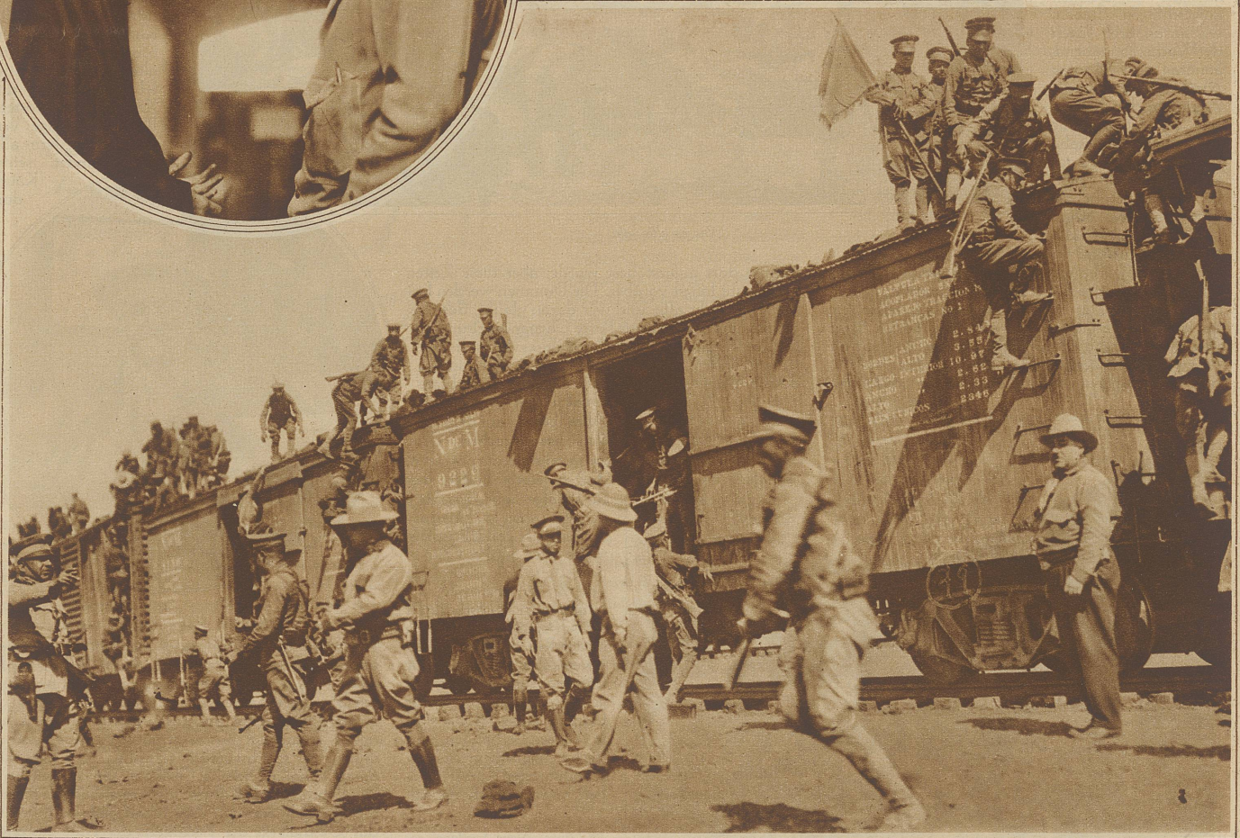
Von Rebellen angegriffener Militärzug der Regierungstruppen