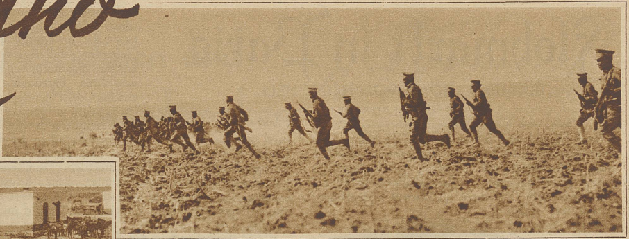
Ein Militärzug mit 1000 Soldaten, der fünf Züge mit Waffen und Lebensmitteln zu schützen hatte, wurde von den Aufständischen angegriffen. Das Bild zeigt den Gegenangriff der Regierungstruppen