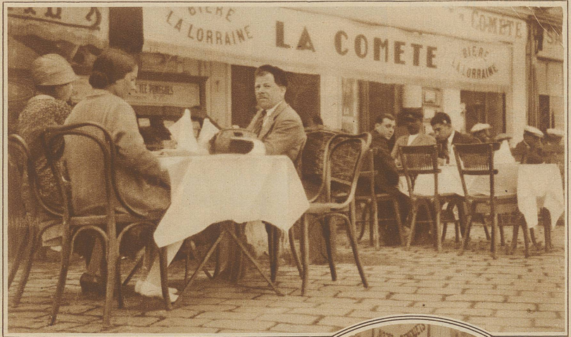
Hier ißt man die Bouillabaisse

Immer noch umweht die großen Hafenstädte ein Hauch jener alten Matrosenromantik, die uns als Knaben schon kein höheres Ziel kennen ließ, als das, selbst Seemann zu werden, Abenteuer zu bestehen, um schließlich nach langer Fahrt heimkehren zu dürfen, dorthin, wo in enger Gasse sich Kneipe an Kneipe drängt,