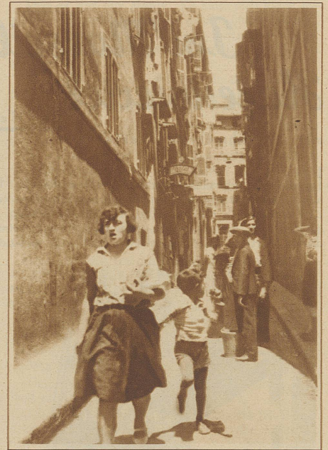
Eine der unheimlichen, engen Straßen

Phantasie sich nicht grausiger auszumalen imstande ist, vor allem eine Bevölkerung, deren Hautfarbe variiert vom schwärzesten Schwarz über Braun und Gelb bis zum käsigem Weiß der im ständigen Dunkel elender Behausungen Dahinvegetierenden, grauerregende, zerfallene Häuser, die oft noch Spuren edler Architektur vergangener Zeiten aufweisen – das ist das Marseiller Vieux Quartier, ein eigentliches Eldorado aller Sensationshungrigen und wie gesagt, oft genug auch sogar ihr Inferno.