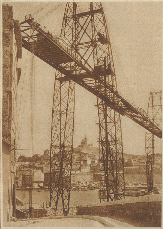
Die große Schwebelücke am Eingang zum alten Hafen

würdig einfügt. Immer und immer wieder berichten die Zeitungen von Verbrechen, die dort begangen wurden, und mehr als einer betrat nichtsahnend das Quartier, von dessen Verbleib man nie wieder hörte. Je tiefer man in diese Welt eindringt, desto grauenerregender wird ihr Charakter. Haufen von Unrat, in denen sich Kinder wälzen, hemmen den Weg, Schmutzbäche stürzen über zerbröckelnde Treppenstraßen hafenswärts, Dirnen stehen wenig bekleidet in offenen Fenstern und suchen sich der Kopfbedeckung des Passanten zu bemächtigen, in der Hoffnung, daß jener, um sie wieder zu erlangen, ihre zweifelhafte Behausung betritt. Da von einer Polizei nirgends etwas zu sehen ist, man sagt, selbst diese getraue sich nicht, der straffen Verbrecherorganisation im Hafenviertel entgegenzutreten, geschieht es oft, daß urplötzlich eine Horde wüster Burschen den harmlosen Fremden umdrängt und mit ihm Streit beginnt,