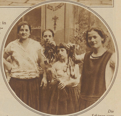
Die Schönen vom «Vieux Quartier»

stehen. Ich wenigstens kenne keinen Ort in Europa, wo der Charakter des Unheimlichen, Lichtscheuenden sich bis zum heutigen Tag mit einer derartigen Realistik erhalten hat, wie im Marseiller «Vieux Quartier», der Gegend zwischen altem und neuem Hafen, in unmittelbarer Nähe des offenen Meeres. Am Ende der Cannebière, Marseilles Hauptstraße und Glanzpunkt, dehnt sich der alte Hafen mit seinem Gewirr von Masten und kleinen Dampfern, umschlossen von den steilen Häuserfronten eines südlichen Baustils und in der Tat noch ganz mittelalterlich anmutend. Hier geht es noch recht gesittet zu; man kann an den Ständen die Austern für zwei Francs das Dutzend gleich an Ort und Stelle verzehren oder in den sauberen und appetitlich anmutenden Restaurants eine Bouillabaisse, die traditionelle Fischsuppe der Côte d'Azur, ohne Sorge für seinen Magen kosten. Nicht mehr so harmlos ist die Sache, wenn man, rechts vom Quai du Port abbiegend, das eigentliche Hafenviertel betritt, und vor allen Dingen Frauen ist von einem Besuch dieser Gegend dringend abzuraten. In den