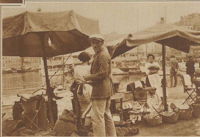
Fischhandel am alten Hafen

wo die alten Sailors beim Grock sitzen und ihren Garn spinnen, kurz, wo wir als wahre Männer gefeiert würden. Später lasen wir dann in den Magazinen schauerliche Novellen, die an solchen Orten spielten und das idyllisch Verträumte der Hafenstädte wandelte sich ins mystisch Dramatische; Messer blinkten im Dämmer trüber Laternen und der letzte Schrei hinterrücks Ermordeter verhallte im Tosen der nahen Brandung. Mit Vorliebe wählte der Autor solcher Geschichten Marseille als Schauplatz seiner Handlung, und wer einmal einen Blick ins Milieu des Hafenviertels dort geworfen hat, kann diese Wahl ver-