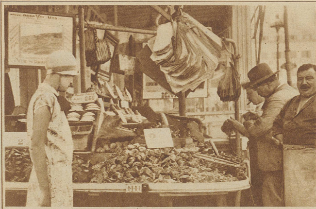
Austerstand eines Restaurants. Das Dutzend kostet Fr. 2.50 französisches Geld

Silbern klingend und springend die Heuer. Ein kleines Monte Carlo auf der Straße