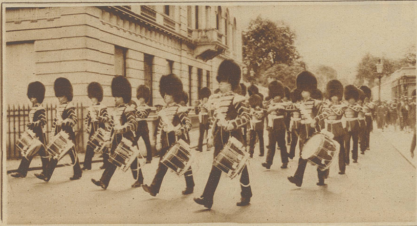
Die Leibgarde des Königs von England