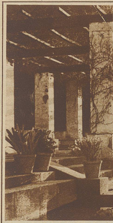
Gartenlaube im Park Mont-Juich