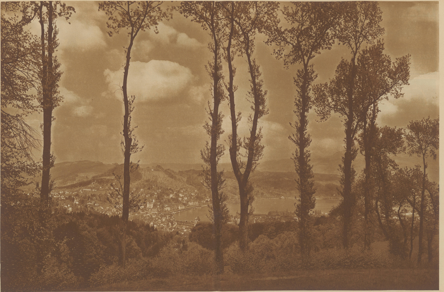
BLICK AUF LUZERN VOM SONNENBERG AUS