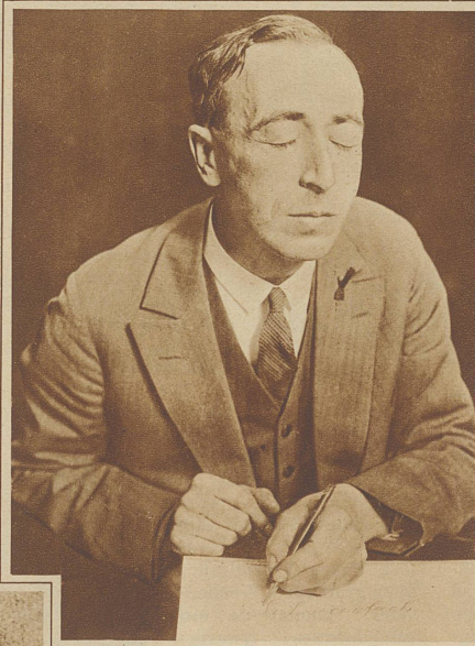
Unteres Bild: Gedanken-Konzentrationsübung. Um die Sicherheit der linken Hand — welches die Diebeshand ist — zu erhöhen, übt sich Meister Langfinger im Schreiben mit geschlossenen Augen und zwar schreibt er kopfstehende Buchstaben von rechts nach links

Finger äußerst gelenkig machen und seinen Geist schärfen, um in jeder Lage situationsfähig zu sein, denn gerade das sind seine bedeutendsten Stärken. Die meisten Diebe dieser Sorte haben zum täglichen Ueben eine Trainingspuppe, welche elektrisch geladen ist und jeden falschen Griff registriert, indem sie Klingelzeichen ertönen läßt. Wenn die Glocken schweigen, ist der Griff gelungen. Daß zum Training auch eine tägliche Massage der Finger gehört, ist eigentlich selbstverständlich, denn nur dadurch können sie geschmeidig gemacht und ihre Sensibilität erhöht werden. Die ganze Kunst des Taschendiebstahls ist größtenteils auf die Sorglosigkeit des Publikums aufgebaut. Jeder «Gewiegte» versteht es leicht, das ausersehene Opfer von seinen Taschen abzulenken. Als Arbeitsfeld dienen fast immer nur größere Menschenansammlungen, die