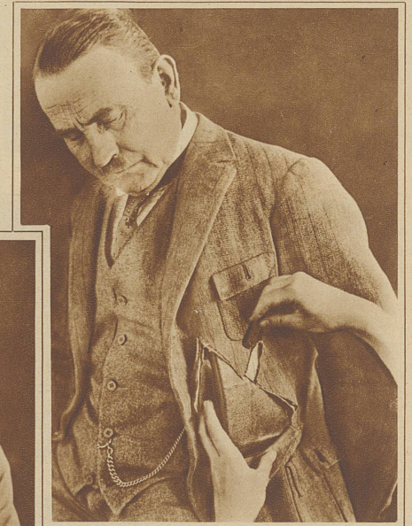
Wie man im Eisenbahzug im Schlaf um die Brieftasche kommt. Die Stelle am Rock, wo die Brieftasche sitzt, wird im Kreuzschnitt mit einer Rasierklinge aufgeschnitten und dann kann der Dieb bequem die Beute herausnehmen

Vorführungen entweder als Helfer oder Beobachter dienen sollen. Während der Experimente mit den Spielkarten räumt er diesen Herren vor dem Publikum