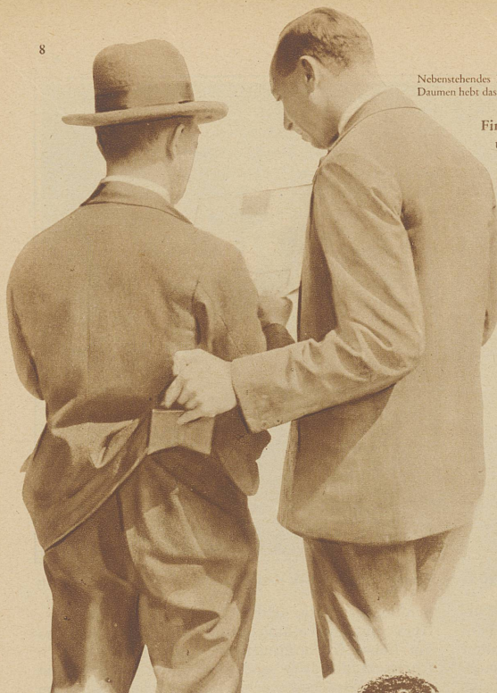
Nebenstehendes Bild links: Eine Brieftasche wird aus der Gesäßtasche «gezogen»: der Daumen hebt das Jackett, der kleine und der Zeigefinger ergreifen pinzettenartig die Brieftasche

Finger äußerst gelenkig machen und seinen Geist schärfen, um in jeder Lage situationsfähig zu sein, denn gerade das sind seine bedeutendsten Stärken. Die meisten Diebe dieser Sorte haben zum täglichen Ueben eine Trainingspuppe, welche elektrisch geladen ist und jeden falschen Griff registriert, indem sie Klingelzeichen ertönen läßt. Wenn die Glocken schweigen, ist der Griff gelungen. Daß zum Training auch eine tägliche Massage der Finger gehört, ist eigentlich selbstverständlich, denn nur dadurch können sie geschmeidig gemacht und ihre Sensibilität erhöht werden. Die ganze Kunst des Taschendiebstahls ist größtenteils auf die Sorglosigkeit des Publikums aufgebaut. Jeder «Gewiegte» versteht es leicht, das ausersehene Opfer von seinen Taschen abzulenken. Als Arbeitsfeld dienen fast immer nur größere Menschenansammlungen, die