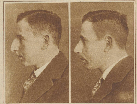
Korrektur der semitischen Nase eines jüdischen Rechtsanwaltes

solchen Plastik ist in die Augen springend, wenn durch die Operation der Gesichtsausdruck gänzlich verändert wird. Meist wird das vom Patienten gewünscht. Bisweilen hat der Operateur aber auch die ausdrückliche Weisung, dem Aussehen nur die Häßlichkeit zu nehmen durch Behebung des exzessiven Charakters der Deformität. Dann muß der Arzt sich an diese Weisung halten. Der Effekt ist in diesen Fällen natürlich weniger augenfällig, das Aussehen ist nur verschönert.