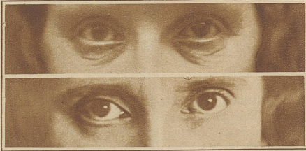
35jährige Dame mit frühzeitiger Faltenbildung der Unterlider. Operative Korrektur ohne sichtbare Narben

Was sind Plastiken? Im alltäglichen Leben bezeichnet man damit die Produkte bildhauerischer Tätigkeit. Der Chirurg versteht darunter eine besondere Art von Operationen, die meist der Verschönerung des Menschen dient. Diese chirurgische Spezialkunst ist schon alt und doch wiederum jung. Schon die alten Inder haben plastische Operationen ausgeführt. In größerer Zahl und mit gutem Erfolge aber wurden dank der Erfindung der örtlichen Betäubung und der Asepsis erst in den letzten 30 Jahren Plastiken gemacht. Deutsche und amerikanische Aerzte haben ungefähr gleichzeitig die Methodik dieser Operationen ausgebaut. In Amerika, dem Lande des Fortschritts, ist diese Kunst in den letzten Jahren sehr populär geworden. Ueber 100 Aerzte befassen sich heute dort ausschließlich mit der Verschönerung des Menschen. In den europäischen Ländern ist ihre Zahl noch gering.