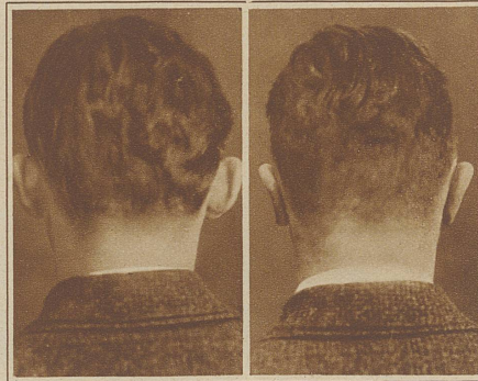
Abstehende Ohren eines Lehrers wurden angelegt

Die Deformitäten der Nase sind sehr mannigfach. Zeigt die Nase eine Höckerbildung, ist sie zu lang — was besonders bei Frauen sehr ungeschön wirkt —