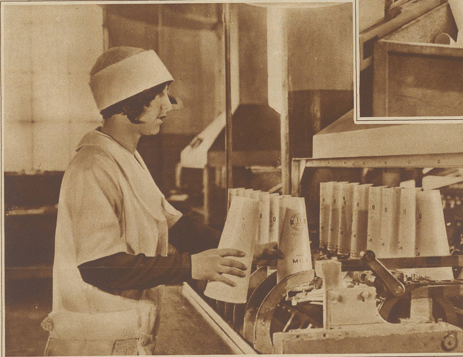
Sterilisierung durch ein Paraffinbad mit anschließender Luftkühlung

Einen unabherrlichen Triumph hat namentlich das Papier zu verzeichnen. In New York sind jetzt durch eine Verordnung sämtliche gläserne Milchflaschen aus dem Verkehr gezogen und durch Flaschen aus Papier ersetzt worden. Man hat herausgefunden, daß die Glasflaschen zu teuer und die Papierflaschen nicht nur selbst hygienisch einwandfrei sind, sondern durch einen Metallverschluß auch jeder Einwirkung durch Bazillen oder Panscher ganz sicher entzogen sind. Man hat ausgerechnet, daß New York im Jahre rund 32 Milliarden solcher Papierflaschen verbrauchen wird.