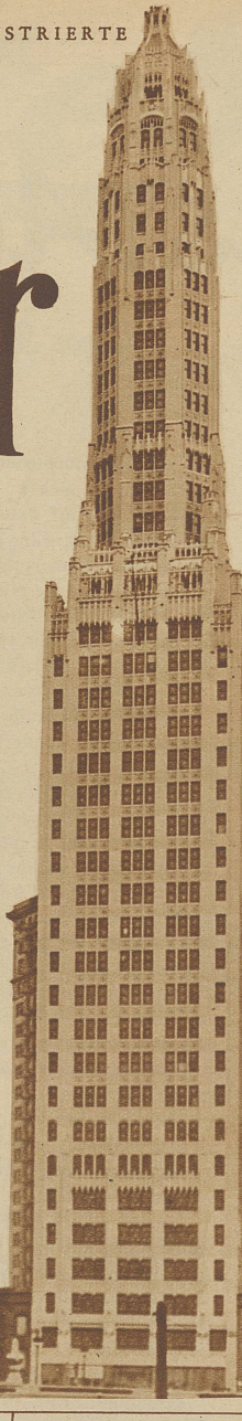
Nebenstehendes Bild links: Das 173 Meter hohe Mathew-Turmhaus in Chicago