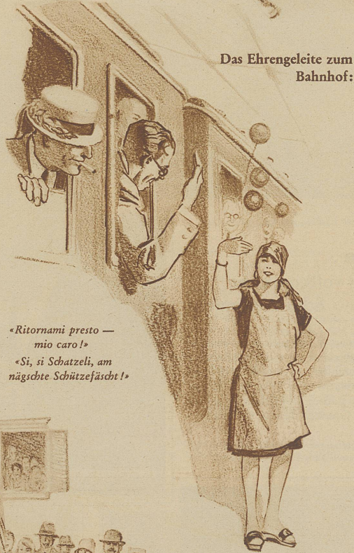
Das Ehrengleite zum Bahnhof:

«He Schaggi, mer händ's wieder e mal g'haue!»