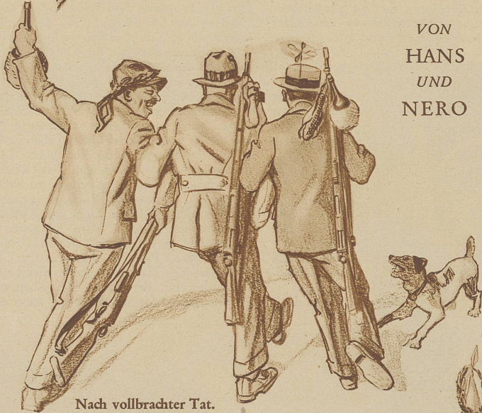
Nach vollbrachter Tat.

«He Schaggi, mer händ's wieder e mal g'haue!»