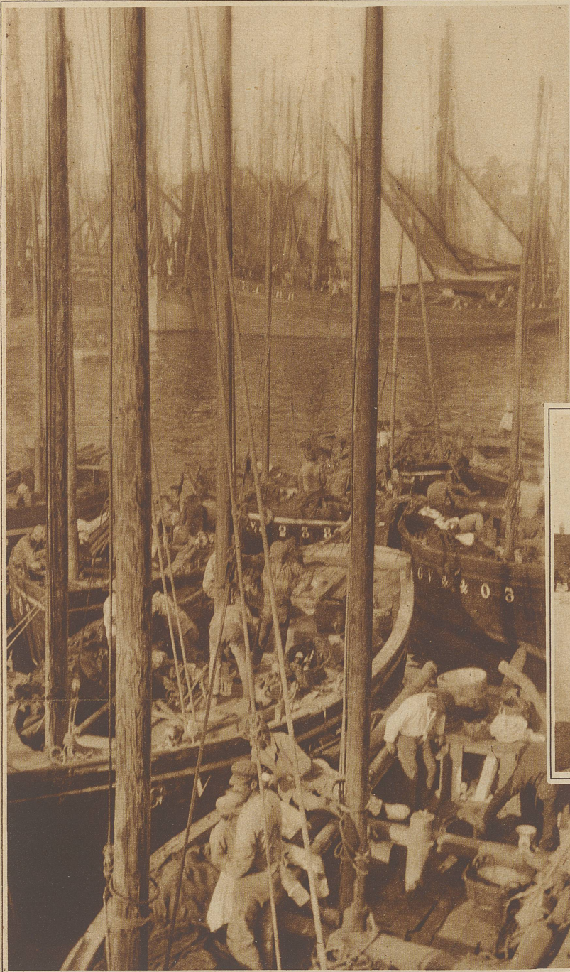
Ein malerisches Bild aus dem Hafen von Concarneau

Die Männer erinnern stark an den urwüchsigen Schlag unserer Appenzeller Bauern