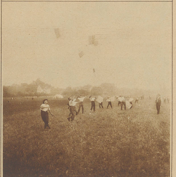
Do — do — do! Lustig wirbeln die Schindeln der Hornusser durch die Luft