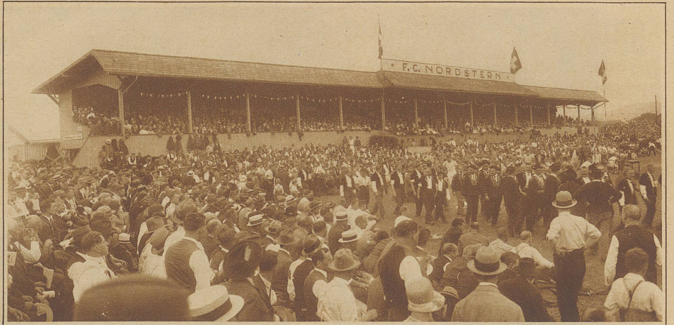
Einzug der Jodler und Schwinger auf dem Festplatz