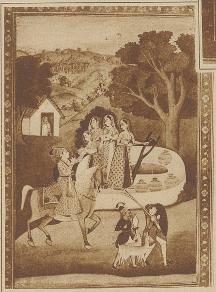
Auszug zur Jagd Die Damen kredenzen dem Jäger Tee

Ich drehte mich um und konnte meine Ueberaschung kaum unterdrücken. Die neue Frau Vandome war eine strahlende Schönheit, die schönste Frau, die ich je gesehen hatte... Und Frans stand dabei wie jemand, der hoffnungslos müde ist.