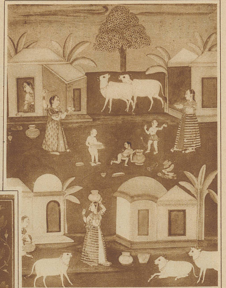
Dorfzene. Die Köpfe der spielenden Kinder haben nicht die mindeste kindliche Ausdrucksform und könnten ebensogut erwachsenen Personen aufgesetzt werden

«Vielleicht ist es interessant,» erwiderte er. «Siehst du, meine erste Frau, Blanche de Clairefontaine, war sehr schön, das weißt du, solch feine, fast überkultivierte französische Schönheit, wie man sie selten sieht... Aber Renée Serano, meine zweite Frau, war auch hübsch, ein ganz anderer Typus, dunkel, südlisch, geschmeidig, herrlich anzusehen. Und dann Didi, meine dritte. Das war einfach ein Wunder der Schönheit! Männer und Frauen drehten sich auf der Straße um, um ihr nachzusehen.