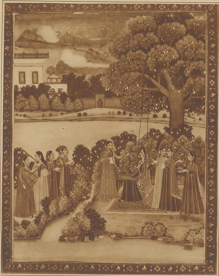
Perstische Fürstin, die Wasserpfeife rauchend. Links im Bilde vier musizierende Dienerinnen

Die Miniaturmalerei ist in allen Kulturgebieten bekannt und sie tritt immer dann am deutlichsten und häufigsten in Erscheinung, wenn die