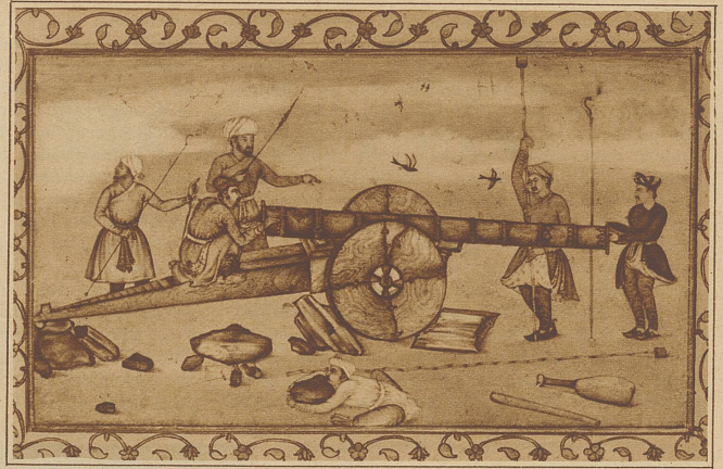
Darstellung einer Kanone. Diese Miniatur aus dem 18. Jahrhundert zeigt schon deutlich den europäischen Einfluß

Bild links: Im Harem. Während die Damen des Hauses Kaffee und Likör trinken, tanzen zwei junge Mädchen nach der Musik einiger Dienerinnen