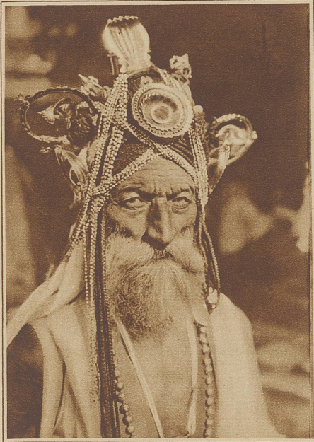
Prachtvoller Kopf eines alten Hindubettelmönchs, der in Bombay für seine Kirche um Almosen wirbt. Der reiche Kopfschmuck deutet allerdings eher auf eine andere Betätigung, als die eines Bettlers hin

«Genau das, was ich sage. Der Mann, der sie einmal heiratet, bekommt einen ganz schönen Sack voll Geld. So ist es doch?»