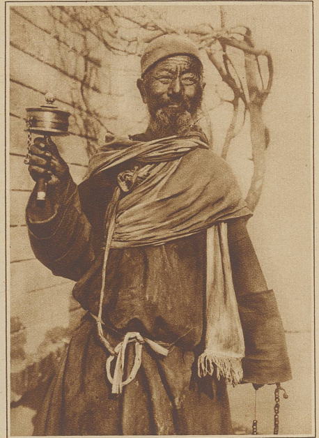
Alter tibetanischer Bettelmönch mit einer Gebetsmühle. Ein Typ, wie man ihn in den Städten Tibets häufig trifft

Black hatte einmal bei einer Gelegenheit seine An-