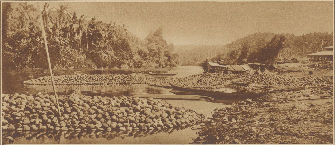
Wie man auf den Philippinen die Kokosnüsse verfrachtet. Sie werden nicht etwa auf Schiffe verladen, sondern zu großen Flößen vereinigt und so aus dem Innern an die Küste gebracht