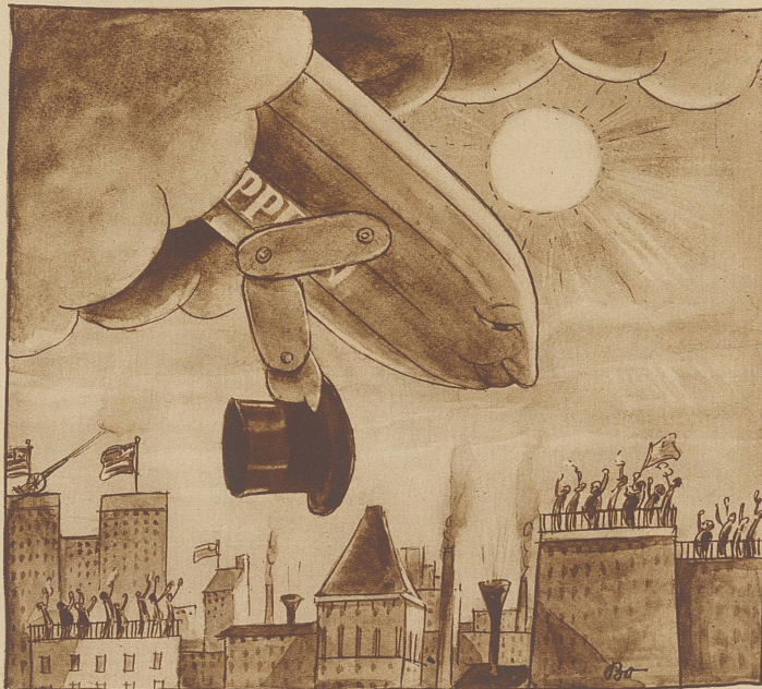
«Die nächsten Luftschiffe werden nicht nur größer gebaut werden, es muß auch an der Spitze eines jeden Luftschiffes eine Vorrichtung angebracht werden, welche Dankesbezeugungen deutlich zum Ausdruck bringt.»

(Als das Luftschiff sich San Franzisko näherte, heulten die Sirenen und die Kanonen schossen einen Salut. Auf den Dächern der Gebäude und in den Straßen jubelte die Menge dem Zeppelin zu, als er majestätisch aus einer Wolkenbank hervorbrach. Als Dank für die Zurufe der Menge in den Straßen und auf den Dächern senkte der Zeppelin dreimal seine Spitze).