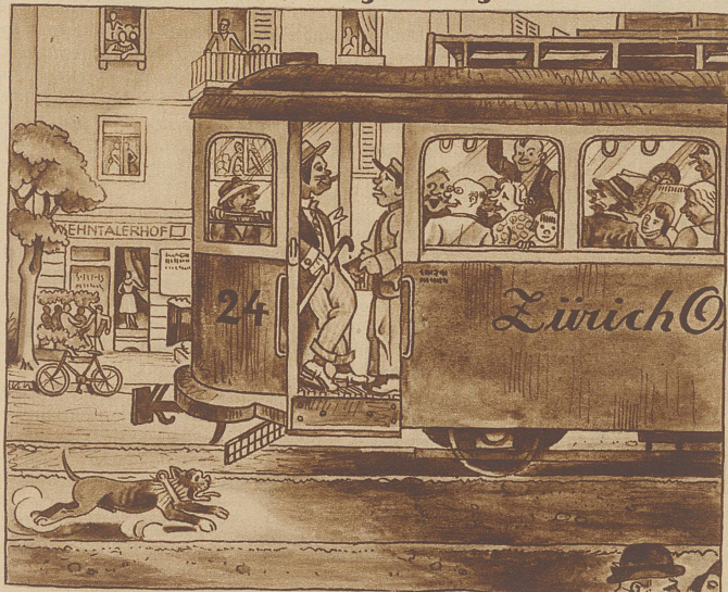
Fahrgast im Oerlikoner Tram: «Nach Seebach» Kondukteur: «In Tiergarte????»