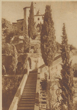
Morcote am Luganensee