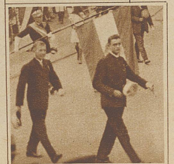
Die Studenten im Vollwuchs ziehen ihre Mützen vor dem St. Jakobsdenkmal