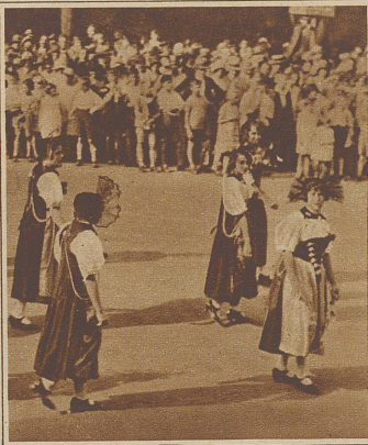
Berner Leist. Die Berner Meitschi nahmen sich zwischen all den Landsknechten und Kriegserinnerungen sehr herzerfreudend aus