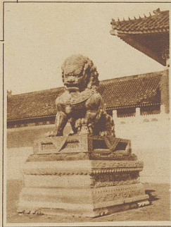
Bild rechts: Wachender Löwe im Tempelbezirk einer chine- sischen Stadt, den zu betreten jedem Europäer verboten ist

sehen Kraft gezogen, voran, kletterte eine schmale, steile Treppe herab und befand mich unversehens in einem breiten, niedern Nachen, der bereits vom Quai abgestoßen war und mit unglaublicher Geschicklichkeit zwischen all den riesenhaft über mir drohenden Schiffsrümpfen hindurehgelentet wurde. Auch hierbei zeigte mir der Chineser seinen Rücken. Wortlos trieb er das Boot mit einer Ruderstange ins Unbekannte.