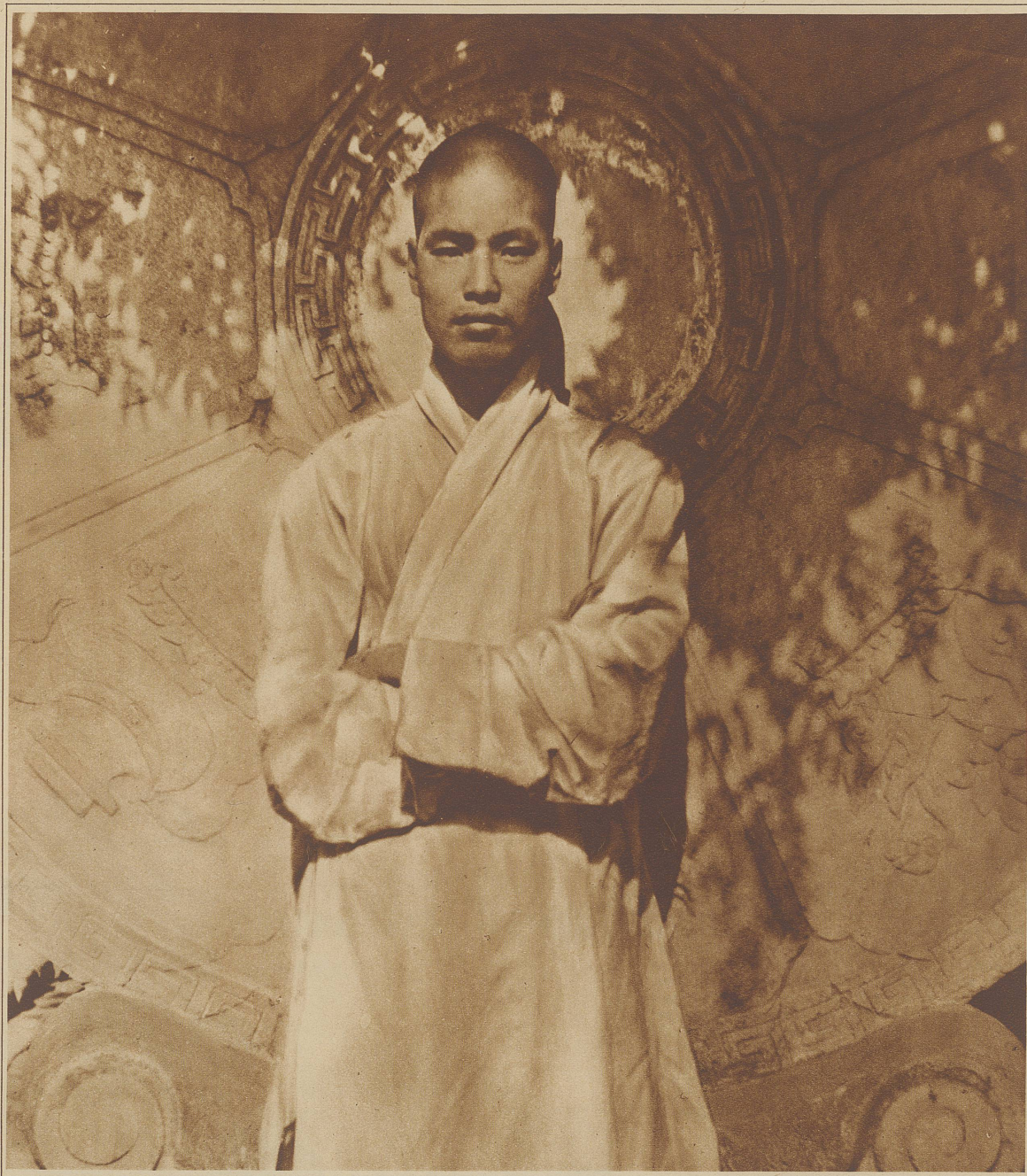
EIN JUNGER BUDDHAS

selbst war verschwunden. Das letzte was ich von ihm gesehen hatte, waren seine langgliedrigen Hände, die sich in der Dunkelheit geisterhaft hin und her bewegten. Auch die Papierlaternen waren erloschen; das Licht schien von den beiden Buddhafiguren selbst auszugehen.