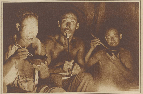
Chinesische Kulis beim Essen (mit Stäbchen) und Rauchen