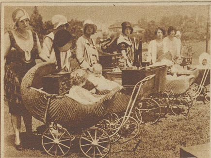
Sie machen auf einer Radioausstellung mit Lautsprechern einen Wettbewerb unter Kinderwagen mit Inhalt. Jeder Wagen erhält einen Lautsprecher verschiedener Marken, um das Kleine einzuschliffen. Der Lautsprecher, dem das zuerst gelingt, siegt