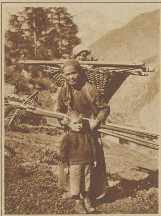
Walliser Bäuerin aus Saas-Fee. Sie bleibt bei ihrem gleichmäßigen harten und uralten Tagewerk