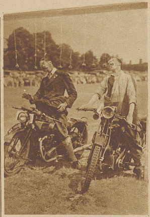
Motorradhindernisrennen. Die Konkurrenten haben zu stoppen und ohne Mithilfe der Hände einen Apfel von der Schnur zu beißen