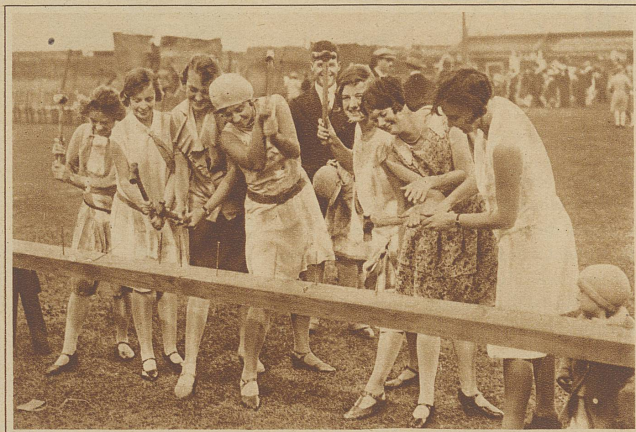
Ein Wettbewerb im Nägeleinschlagen