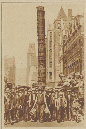
Jim, der Gemüsehändler in London gewinnt einen Korbträger-Wettbewerb