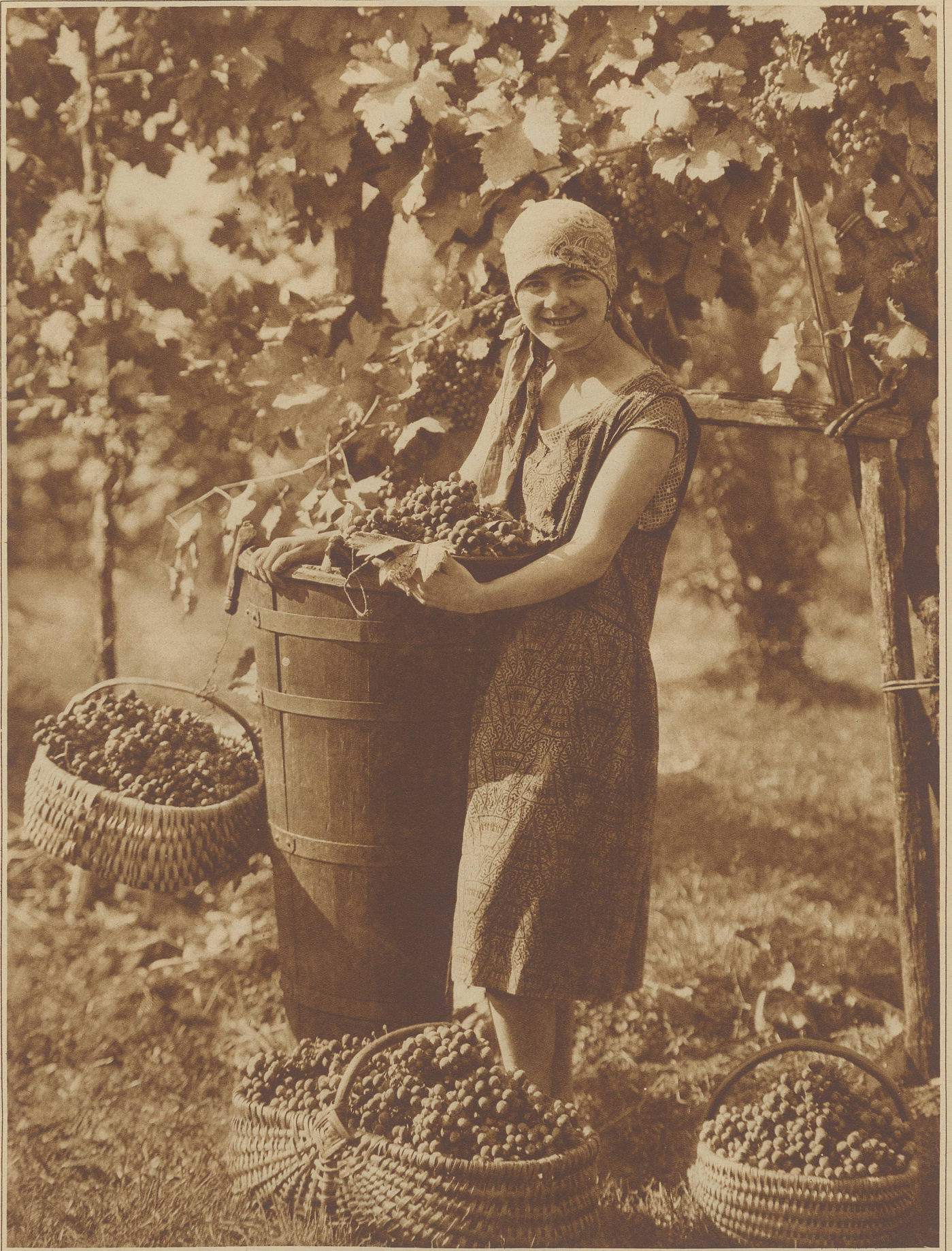
Die ersten Tessiner Trauben