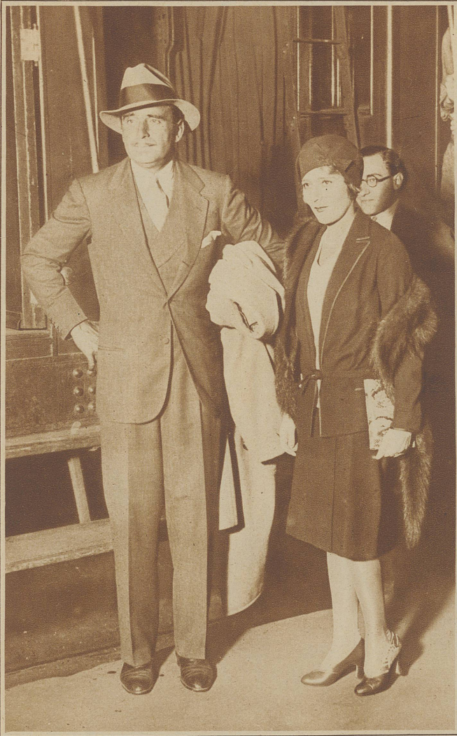
Douglas Fairbanks und Mary Pickford, die zwei beliebten, weltbekanntesten und wirklich sehr sympathischen Filmsterne, finden es in Paris zurzeit überaus heiß und wollen schleunig in die Schweiz weiterreisen. Douglas Fairbanks und Mary Pickford beim Umsteigen in einem Pariser Bahnhof