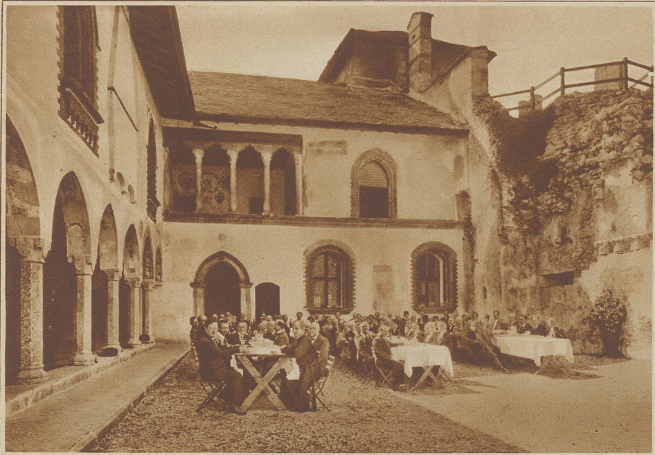
Beim Mittagessen im Schloßhof von Locarno