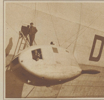
Eine der fünf Motorgondeln, in die man über eine Leiter aus dem Innern des Luftschiffes gelangt