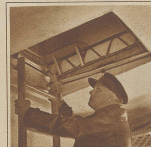
Aufstieg durch die Luke ins Innere des Luftschiffes