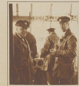
Die Offiziere in der Führerkabine