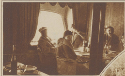
Blick ins Speisezimmer