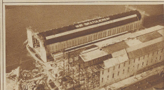
Ueber den Luftschiffhallen in Friedrichshafen. Die Aufschrift auf dem Dache zazant noch vom Weltkrieg her