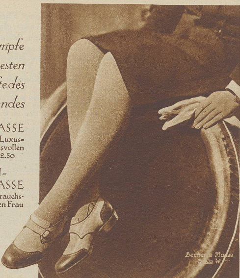
Becker & Madsen Bismarckstr. 10 Zürich

Auch die ELBEO- Kunstseidenklasse er- füllt alle Erwartungen einer verwöhnten Frau Fr. 5.90 bis 8.50