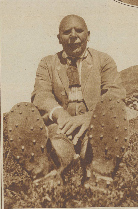
Wilhelm Bockholt Beckmesser in den Ferten