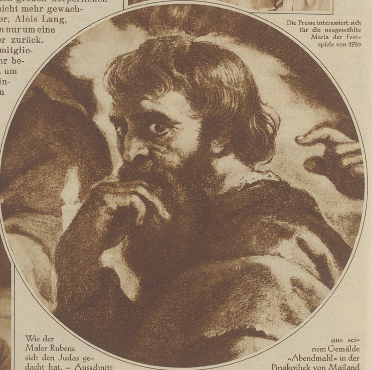
Wie der Maler Rubens sich den Judas geadacht hat. - Ausschnitt