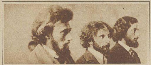
Oberamergauer Jünglinge in der Kirche