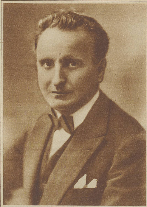
Cav. Salvatore Salvati,

lyrischer Tenor der Scala in Mailand, in der Schweiz durch Konzerte und Gastspiele an den verschiedenen Theatern bekannt, wird diesen Winter wieder eine Konzertreise durch unser Land unternehmen