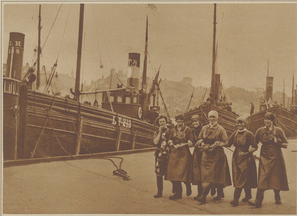
Der Heringsfang beginnt. Alljährlich kommen um diese Zeit Hunderte von Fischermädchen aus Schottland und von den nördlichen Inseln nach Great Yarmouth (Norfolk), um dort den Fischern beim Verarbeiten der reichen Beute behilflich zu sein. Die Aufnahme zeigt eine Gruppe fröhlicher Fischermädchen bei einem Spaziergang am Hafen

Wie sie aber dieses Kunstwerk vollbracht, blieb mir ein Wunder (noch immer bin ich bereit, an