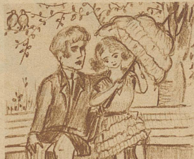
Ist die Sache dann im reinen Und das Inserat geglückt, Muß ich elegant erscheinen Daß die Männer ganz entzückt.