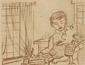
Und die Zähne ließ ich plombieren Bei dem Zahnarzt nebenan. Und die Haare hoch frisieren Beim Coiffeur «Herr Krüthenmann»