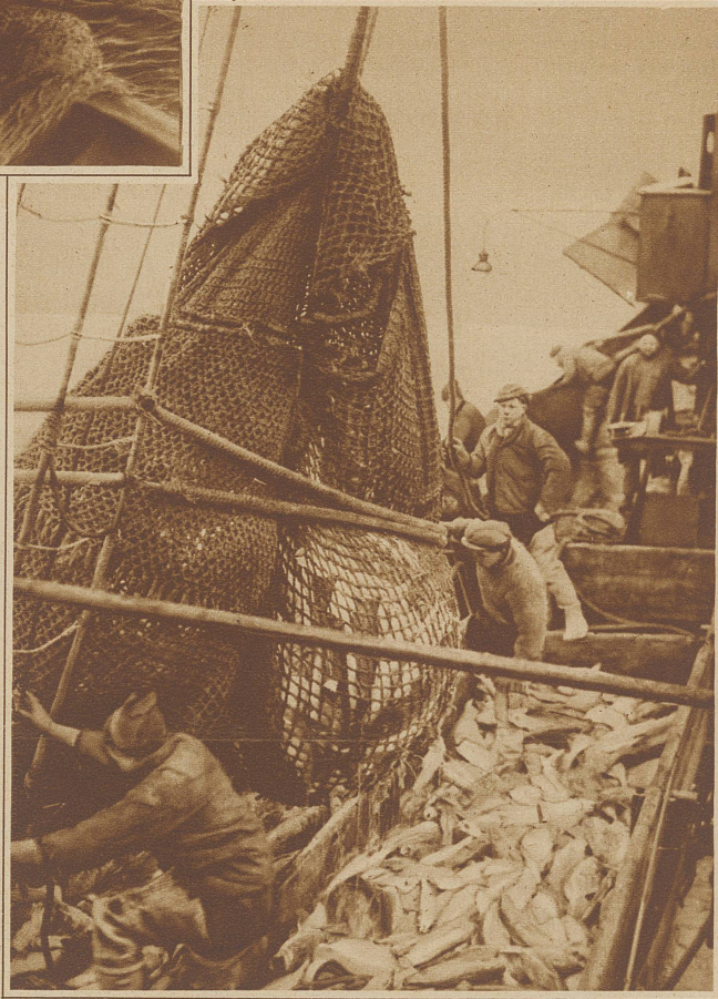
«Der große Augenblick.» Ein guter Fang — Das Netz kommt an Bord

Um drei Uhr nachts kam der Befehl, das Netz einzuholen. Schlaftrunkene Gestalten stolpern aus ihren Kojen hinaus an Deck, sich den Bewegungen des schwer arbeitenden Schiffes anpassend. Ein eisiger Nordwest benimmt den Atem. Festhalten. Die Leute rufen es sich zu, die brüllende See öffnet es ihnen nach. — Festhalten! Ein schwerer Brecher schlägt krachend an Deck, gegen die Körper, daß es schmerzt. Hol fast!! Zischend und knatternd beginnt die Dampfwinde ihre Arbeit und bringt nach einer Ewigkeit das Netz an die Oberfläche. Erstarrte Finger verkrampfen sich in die Maschen, reißen es an Bord. Aber das Meer will es nicht hergeben, es scheint sich mit dem Sturm verbunden zu ha-