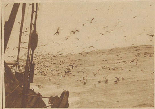
Unzählige, hungrige Möven folgen dem Fischdampfer

Nachdem das Netz wieder angesetzt ist, beginnt das Schlachten. Die Fische werden ausgenommen, gesäubert, gründlich gewaschen und dann im Fisch-