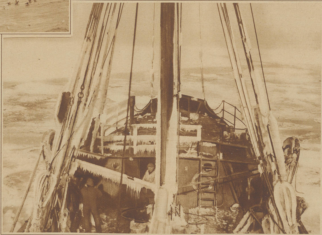
Fischdampfer im Treibeis an der Nordwestküste Islands

Wir setzen unser Netz aus, ein 50 m langes, nach dem Ende spitz zulaufendes, starkes Gewebe mit einer 35 m breiten Öffnung. An jeder Seite dieser Öffnung befindet sich ein schweres, eisenbeschlagenes Brett, das sogenannte Scheerbrett. Diese Bretter sind