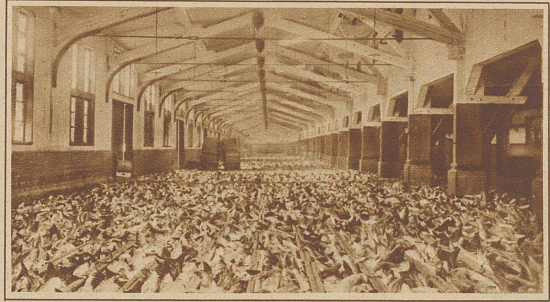
Wesermünde, der größte Fischereihafen des Festlandes. Auktionshalle, in der die Fische zur Versteigerung gebracht werden

ben, der das Schiff mit beängstigender Schnelligkeit den Klippen, dem sicheren Verderben zutreibt. Und es entspinnt sich ein erbitterter Kampf. Das Salzwasser brennt in den Augen, friert an den Händen, aber keiner läßt los. Und sie schaffen es! — Nun ist das Schiff von einem schweren Hindernis befreit, wir steuern der offenen See zu, das Gedonner der verhängnisvollen Brandung wird schwächer. Wir sind gerettet. Am Morgen ist alles vorüber. Die Sonne lacht, nur eine hohe Dünung plätschert unschuldig gegen die Bordwand.