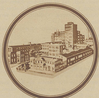
Bevorzugen Sie das Präparat einer der größten, hygienisch und technisch vorbildlich eingerichteten Fabriken der Welt.