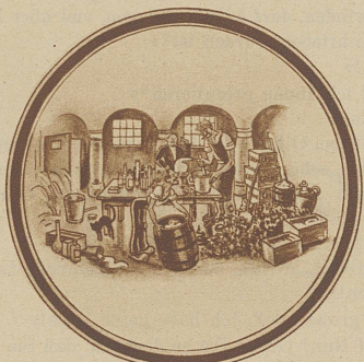
Meiden Sie Hautpflegemittel, die aus unhygienischen, primitiven Laboratorien stammen, viel kosten und nichts nützen.

Ich sah auf dem Nachttisch, auf demselben Platz wie am Abend vorher, Bücher meiner beiden Lieblingsschriftsteller Edgar Poe und Turgenjeff und daneben die Hand aus weißem Marmor von der, die nicht mehr unter den Lebenden weilte. Die Hand meiner lieben Frau, die ich einige Stunden nach ihrem Tode gießen ließ, um so das Bild und die Form tadellos rein zu wahren.