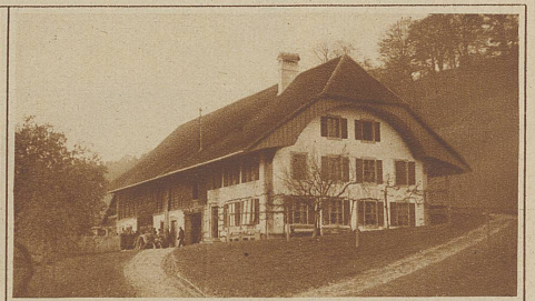
Bundesrat Scheurers Elternhaus, in welchem er alljährlich seine Erholungsstunden verbrachte und seiner Mutter das Feld bestellen half. Vor dem Hause steht sein Sarg mit Blumen bedeckt