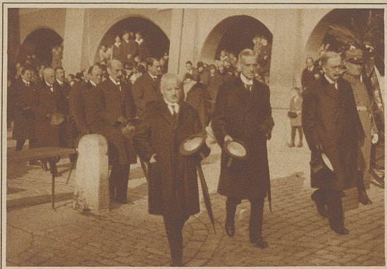
Eine der letzten Aufnahmen des verstorbenen