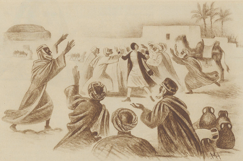
Eine Geste, ein unvorsichtiger Blick genügt – und die ganze Horde der Reiseführer stürzt sich auf das unglückliche Opfer