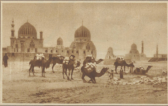
Vor den Kalifengräbern

Ein Führer wird dir jederzeit und überall einen Esel oder ein Kamel, einen Wagen oder ein Boot verschaffen — natürlich alles zu exorbitanten Preisen! —, er wird dich bereitwilligst zu allen möglichen und unmöglichen Unterhaltungs- und Vergnügungsstellen, so «echt» und so «einheimisch» du nur immer wünschst, geleiten und wird dir zu jedem persönlichen Dienst bereit sein. Tatsache ist, daß der wahre Führer vor nichts zurückschreckt, sich in allem und jedem unentbehrlich erweisen will, aber einzig und allein nur ein Ziel kennt: möglichst viel Geld dabei zu gewinnen. Nun gibt es natürlich eine große Anzahl von vorsichtigen Reisenden, welche aus Prinzip und Geldrücksichten auf einen Führer verzichten. Niemand glaube, daß sie damit die Sache für sich erledigt hätten, daß für sie das «Achtung vor den Führern» keine Wichtigkeit habe. Nein: er mache nur einen Ausflug zu den