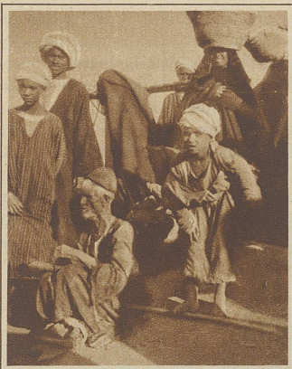
Aus einer Gruppe «Hyänen des Fremdenverkehrs»: Fremdenführer, Wahrsager, Wasserträger, bettelnde Frauen

Ein Führer wird dir jederzeit und überall einen Esel oder ein Kamel, einen Wagen oder ein Boot verschaffen — natürlich alles zu exorbitanten Preisen! —, er wird dich bereitwilligst zu allen möglichen und unmöglichen Unterhaltungs- und Vergnügungsstellen, so «echt» und so «einheimisch» du nur immer wünschst, geleiten und wird dir zu jedem persönlichen Dienst bereit sein. Tatsache ist, daß der wahre Führer vor nichts zurückschreckt, sich in allem und jedem unentbehrlich erweisen will, aber einzig und allein nur ein Ziel kennt: möglichst viel Geld dabei zu gewinnen. Nun gibt es natürlich eine große Anzahl von vorsichtigen Reisenden, welche aus Prinzip und Geldrücksichten auf einen Führer verzichten. Niemand glaube, daß sie damit die Sache für sich erledigt hätten, daß für sie das «Achtung vor den Führern» keine Wichtigkeit habe. Nein: er mache nur einen Ausflug zu den