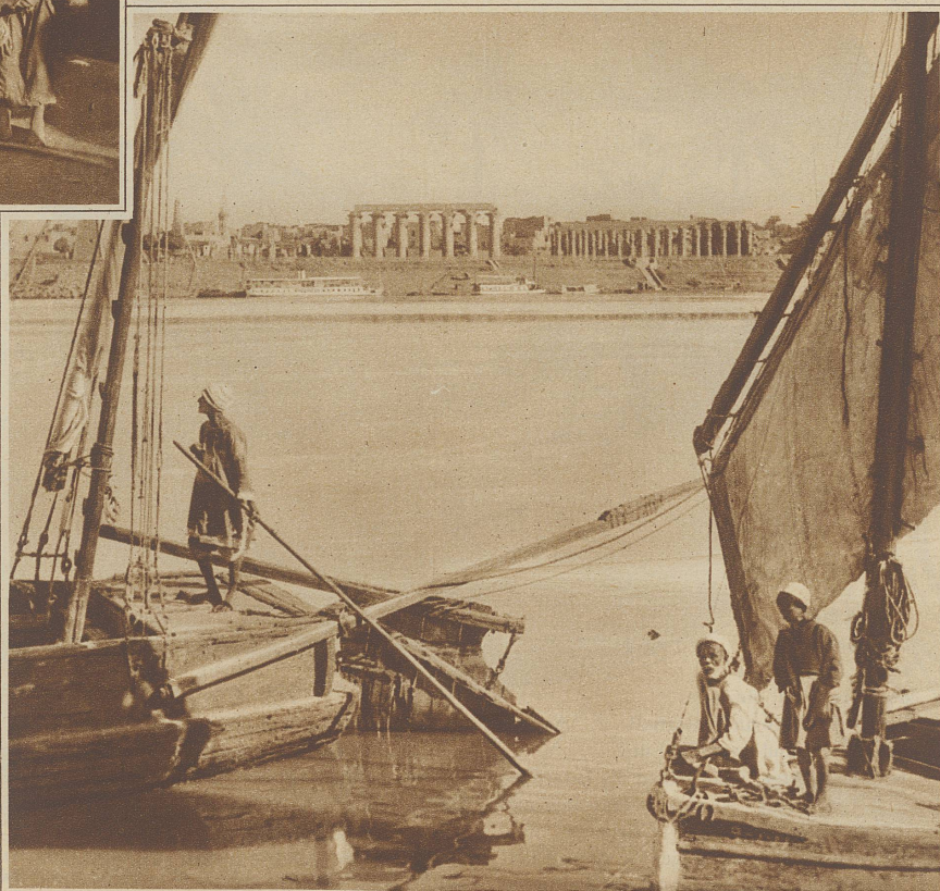
Bild links: Am Nil bei Luxor. Im Hintergrunde die Säulen alt- ägyptischer Tempel

Ein lang in Aegypten ansässiger Bekannter von mir hat sich neulich einen Spaß erlaubt. Sein Führer — natürlich mußte er auch einen Führer haben! — der sich nebstbei den hochtrabenden Namen Bismarck zugelegt hat und meinem Bekannten wohl an die zwanzigmal um die Pyramiden nachspaziert ist, wollte ihm wieder einmal «wahrsagen» und verlangte, daß er fünf Piaster in die Mitte der Sand-Sonne lege. «Du bist wohl verrückt», wehrte der Europäer, «würdest du dir für 5 Piaster wollen wahrsagen lassen?» «Ja sicherlich», beteuerte Bismarck, worauf der alte Herr selbst eine Sonne in den Sand zeichnete, Bismarck ein 5 Piasterstück in die Mitte legen hieß und ihm in fließendem Arabisch die schönsten Dinge über zukünftiges «Filus» (Geld) und Liebesglück erzählte. Dann wollte er lachend die fünf Piaster einstecken, aber Bismarck, der wohl verstanden hatte, kam ihm zuvor, ließ das Geld schnell in die Tasche seiner Galabieh verschwinden und streckte dann fordernd die Hand aus: er kassierte den 5 Piaster tarif nun dafür ein, «daß er so weit auf den Scherz eingegangen, sich hatte wahrsagen lassen und so unterhaltend gewesen war». Ja, so sind eben die Führer!