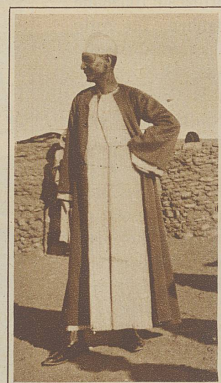
Der elegante Fremdenführer. Bei ihm gehört es zum Beruf, sich photographieren zu lassen