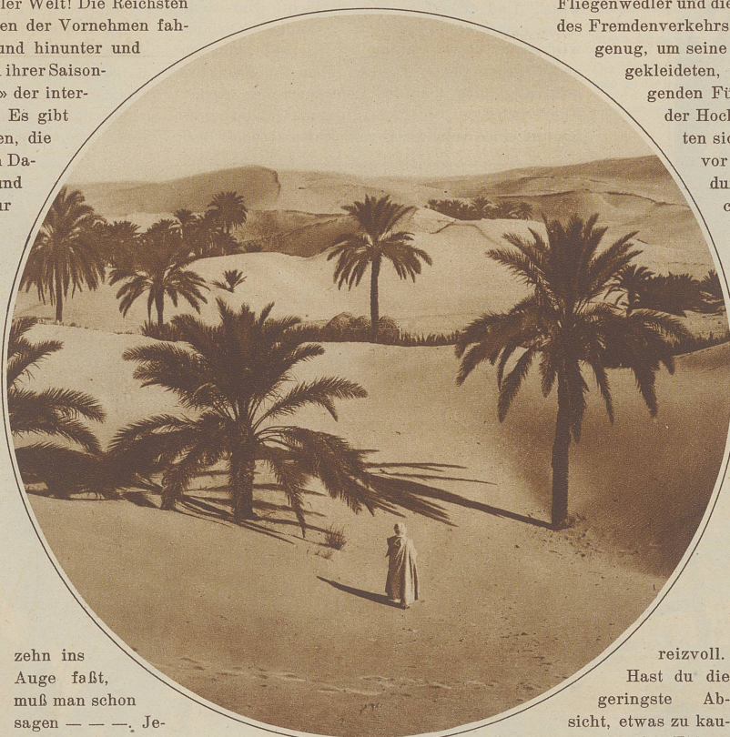
Am Rande der Wüste

käufer, die Schuhputzer, Kamel- und Eseljungen, die Fliegenwedler und die Bakschisch-Schreier die «Hyänen des Fremdenverkehrs»! Welches Tier aber wäre reißend genug, um seine Gier mit der jener seiden-kartan-gekleideten, turbangeschmückten und stocktragenden Führer zu vergleichen, die zur Zeit der Hochsaison, gewollt pittoreske Gestalten sich zu zwanzig und mehr alltäglich vor den großen Hotels versammeln und durch «echt orientalische» Aufmachung und Gebärden Touristen anzulocken versuchen. So ein Führer beherrscht überhaupt jede mögliche Sprache – oder wird durch geschickten Gebrauch einzelner Vokabeln doch ihr Beherrschen vortäuschen wollen – er weiß jeden Weg, jeden Platz, jedes Geschäft, das du zu erreichen wünschst – und führt er dich nicht dahin, so führt er dich doch irgendwohin und hier ist's ja überall interessant und