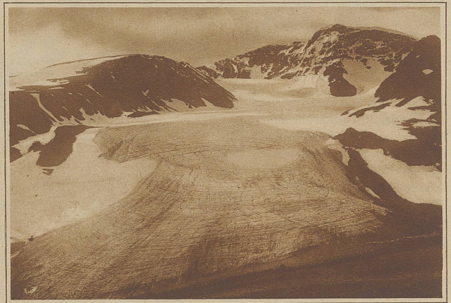
Der Storgletscher, dicht unter dem Kebnekaise, dem höchsten Berg Lapplands und Schwedens überhaupt