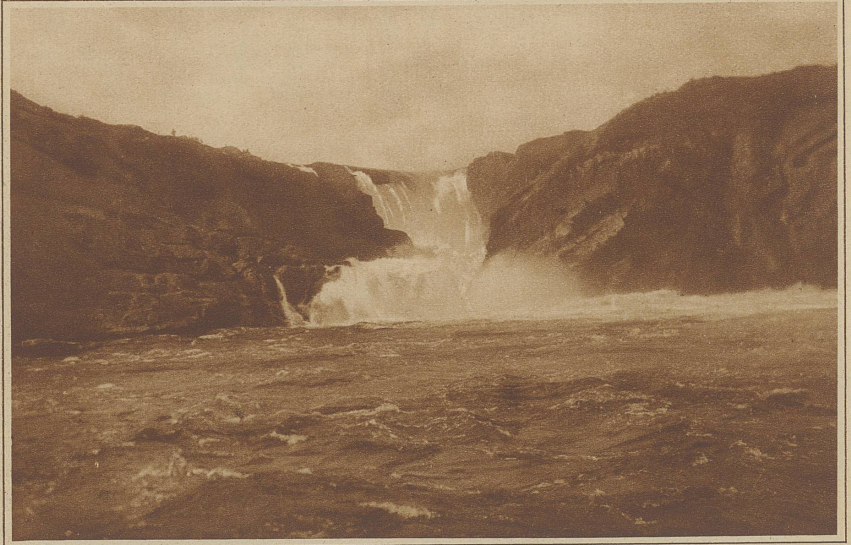
Stora Sjöfallet, der größte schwedische Wasserfall