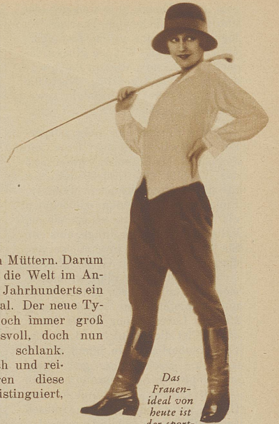
Das Frauenideal von heute ist der sportlich trainierte, vermannlichte Typ