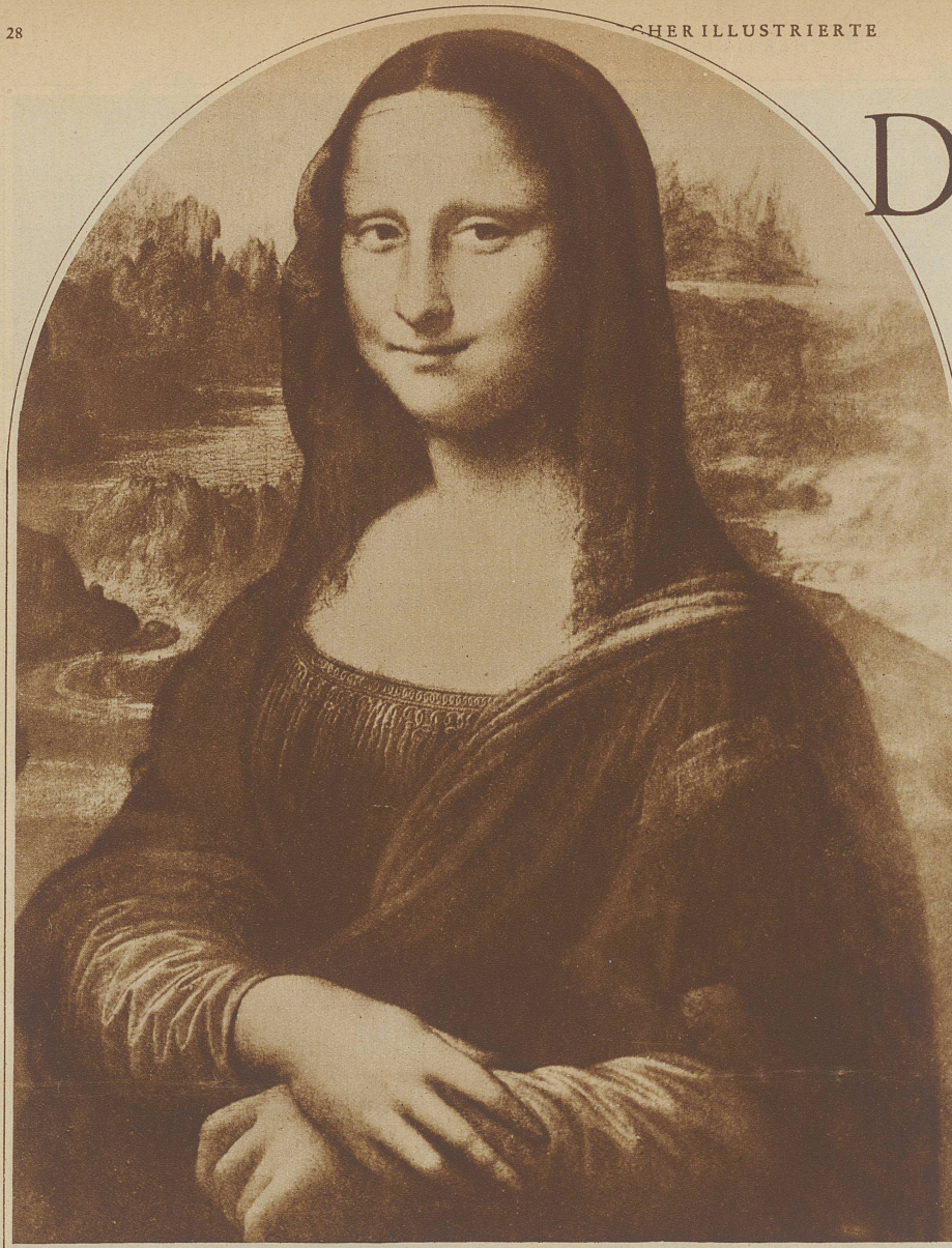
Mona Lisa. Gemälde von Leonardo da Vinci. Ein Beispiel für den Schönheitstyp der klassischen Renaissance