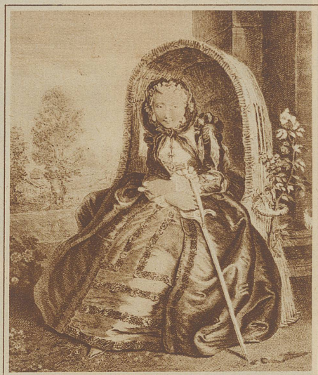
Aus der Zeit des Rokoko

Zu allen Zeiten war die edle Frau der gute Genius des Mannes.