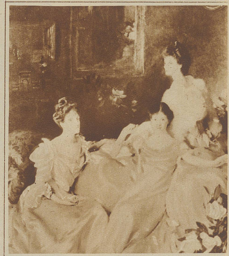
Die drei Frauen Gemälde von Sargent. Ein charakteristisches Bild für die hochbürgerliche Eleganz vom Anfang des Jahrhunderts