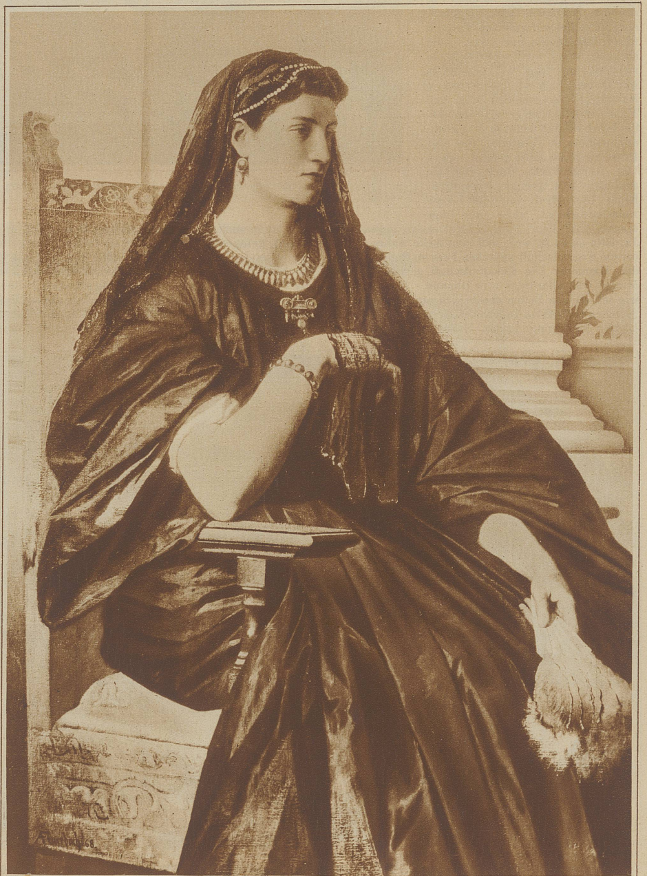
Untenstehendes Bild: Die «Römerin» Anselm Feuerbachs, der ideale Frauentyp der zweiten Hälfte des vorigen Jahrhunderts

allzu harten Müttern. Darum suchte sich die Welt im Anfang des 20. Jahrhunderts ein anderes Ideal. Der neue Typus war noch immer groß und hoheitsvoll, doch nun blond und schlank. Wie fraulich und reizend waren diese Frauen, distinguiert,