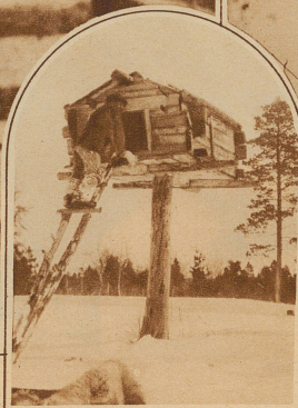
Der Speicher eines lappländischen Bauern steht, mit Rücksicht auf die räuberischen Füchse, auf Pfählen