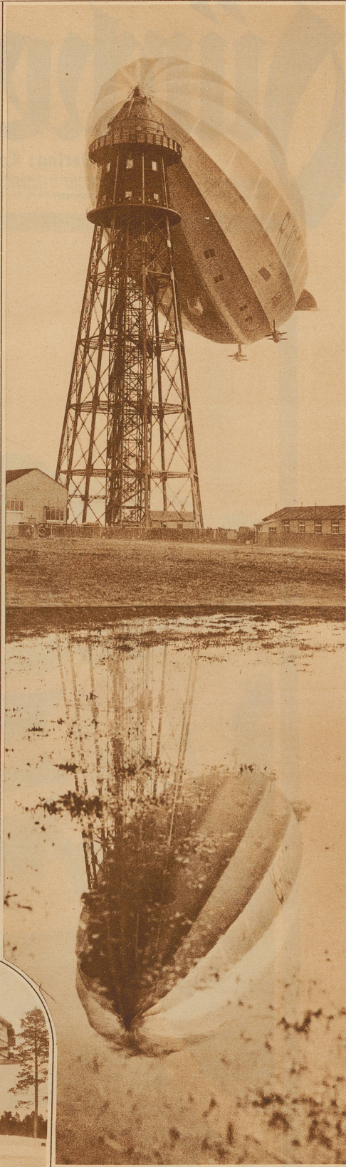
Das englische Luftschiff R 100 spiegelt sich am Mast in Cardington in den Wassern der großen Überschwemmung dieses Winters