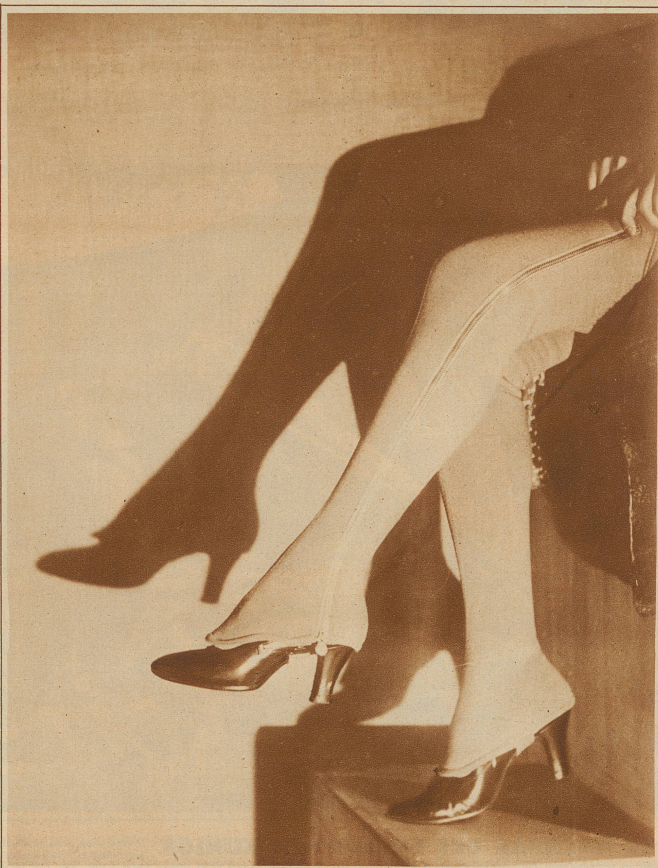
Der elegante Ueberstrumpf.