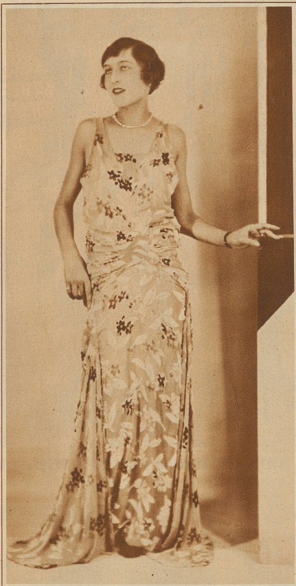
Lang, daß selbst die Schuhspitze unter dem Stoffgewalle verschwindet.

... erkennt auf Grund des «Gesetzes des Ausgleichs» die Reaktion auf das kurze Kleid als naturnotwendig und hebt die Beschränkung der aktuellen Längentendenz auf das gesellschaftliche Kleid als hochinteressant hervor. Auf die Dauer erträgt das Weibliche ein Unterdrücken und Verdrängen tieferer Gefühlswerte durch eine nur zweckmäßige, rationelle Kleidung nicht; es regt sich darum nun wieder ein Bedürfnis nach Verhüllen von eine Zeitlang preisgegebenen Reizen. Diese Verhüllung drängt die