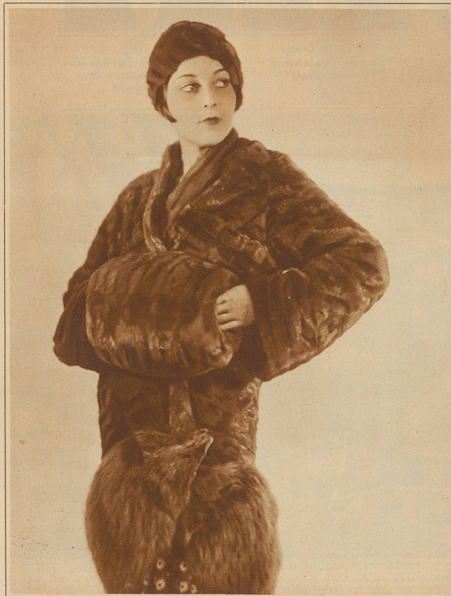
Pelzmantel, Mütze und Muff aus Nutria. Garnierung Blaufuchs.

Sprach man auch anfangs des Winters von Absetzung des Pelzmantels und wurde als feiner der Stoffmantel mit tüppiger Verbrämung und Pelzfutter empfunden, der schön verarbeitete, schmiegsame Pelz wird sich doch immer wieder seine Stellung bewahren. Ein neues Modell ist der dreiviertel lange Pelzmantel mit passendem Muff und Pelztoque. Den Abschluß bildet ein Blaufuchs, vorn etwas höher genommen, daß man noch oberhalb des Knies das Kleid sieht. Eine sehr vorteilhafte Form, denn sie läßt sich zu jeder Kleidlänge tragen, am Tage und Abend. Wenn früher die Herren der Schöpfung sich oft entsetzt haben über den Kontrast der wärmsten Umhüllung des Körpers und der nur hauchdünnen Seidenbekleidung der Beine (wohl auch nur deshalb, weil sie nachgerade zuviel des Guten zu sehen bekamen), so fehlt heute jeder Grund dazu. Man denke nur an all die Variationen in Stulpstiefeln, daß man oft meint, man sei unter die Kosaken geraten. Viele Damen wollen aber auch bei schlechtem Wetter nicht auf die kleine Eitelkeit ihrer tadellosen Beine verzichten; für diese ist die restlos sitzende, jede Form nachzeichnende Gamasche mit Reißverschluß, wärmend und doch elegant. — Weihnachten hatte sicher viel Winterliches auf dem Gabentisch beschert, das Wetter braucht sich nur den neuen Sachen anzupassen. EU.