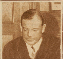
Walter Edge ist als Nachfolger Herricks zum ameri- kanischen Botschafter in Paris ernannt worden