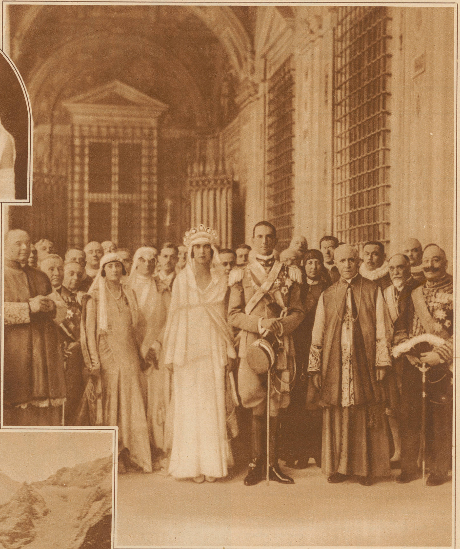
Das neuvermählte Paar im Vatikan, bereit, den Segen des Papstes zu empfangen