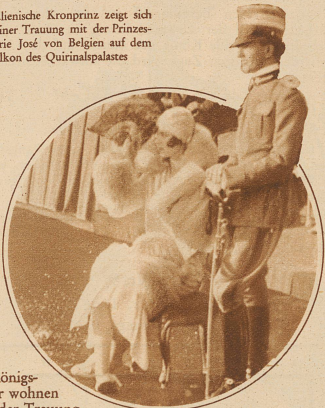
Die Königskinder wohnen nach der Trauung einer zu ihren Ehren veranstalteten großen Parade bei