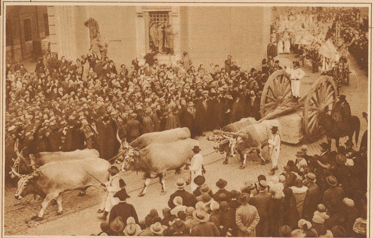
Am Tage der Vermählung fand in Rom ein interessanter Trachtenumzug statt, der das bodenständige Italien von den Alpen bis Sizilien zeigte. Viel Beachtung fand dabei der im Bilde festgehaltene Ochsenzug mit einem viele Zentner schweren Marmorblock