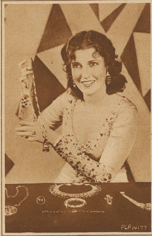
«Alles echt» sagt Miss Macdonald, der Paramount-Filmstar, wenn sie ihre Juwelen vorzeigt. Dies ist zwar nicht modern, aber wir gratulieren trotzdem