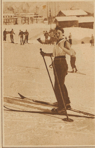
Die warme Wintersonne in Müren inspirierte diese junge Dame zu einem Sportkostüm, bestehend aus einem Badeanzug und langen Hosen