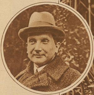
Der polnische Außenminister ZALESKI führt auf der derzeitigen 58. Ratstagung des Völkerbundes in Genf den Vorsitz