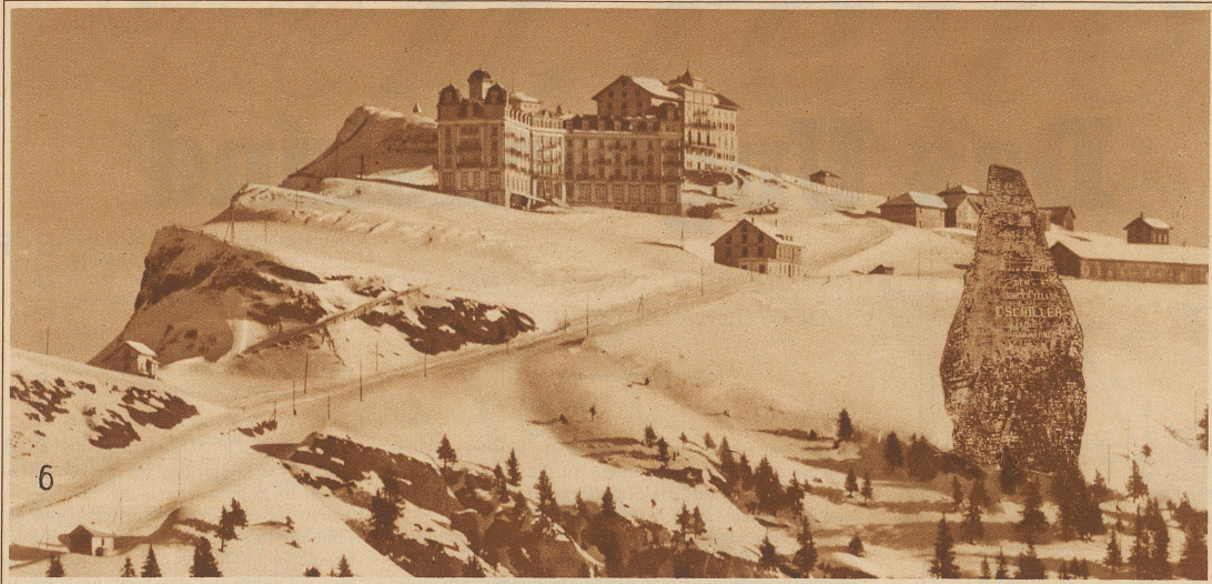
Ueber den Nebeln