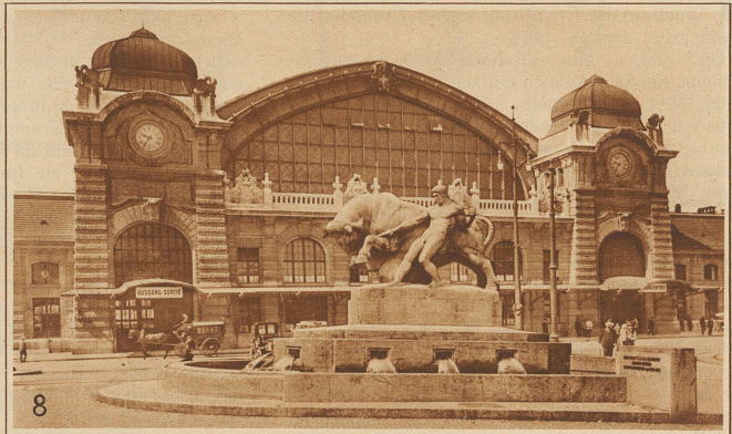
Muuhs i denn, muuhs i denn zum Städtele naus — — — —

während 20 Jahren die ganze Welt vergessen. Er ist aus seinem Laboratorium nicht hinausgegangen, hat dort geschlafen und eine heiße Wurst gegessen zu Mittag oder ein Leberli, wenn's hoch kam, welches ihm die Miggi vom Restaurant gegenüber jeweils vor die Laboratoriumstüre auf einen Stuhl gestellt hat. Der Mann hat keine Jahreszeit beobachtet, hat eine reizende Braut ganz und gar aus dem Gedächtnis verloren, hat sich weder an Zinsen, noch Steuern, noch irgendwas erinnert, und als endlich seine Entdeckung dalag, da waren auch seine bürgerlichen Verfehlungen auf ein solches Maß angewachsen, daß seine Sachen, sein geistiges und gegenständliches Eigentum, gepfändet werden sollte. Grad an dem Tag, da er mit der Entdeckung unterm Arm zu unsern Bundesvätern fahren wollte, um ihnen das Ergebnis seiner Versuche mitzuteilen. Man drang in sein Laboratorium ein, um Siegel an die Gegenstände zu kleben, und der Polizist Handfest sagte zu