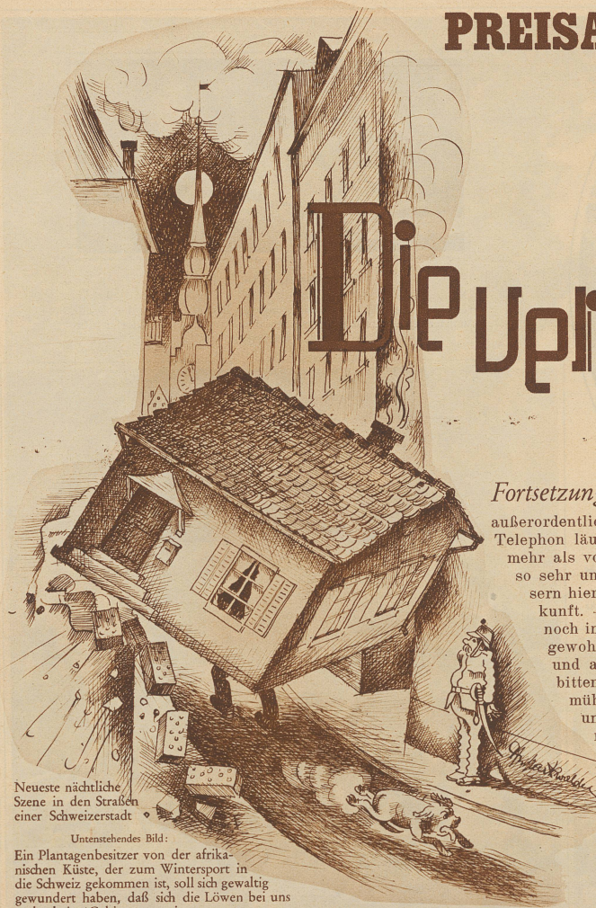
Neueste nächtliche Szene in den Straßen einer Schweizerstadt