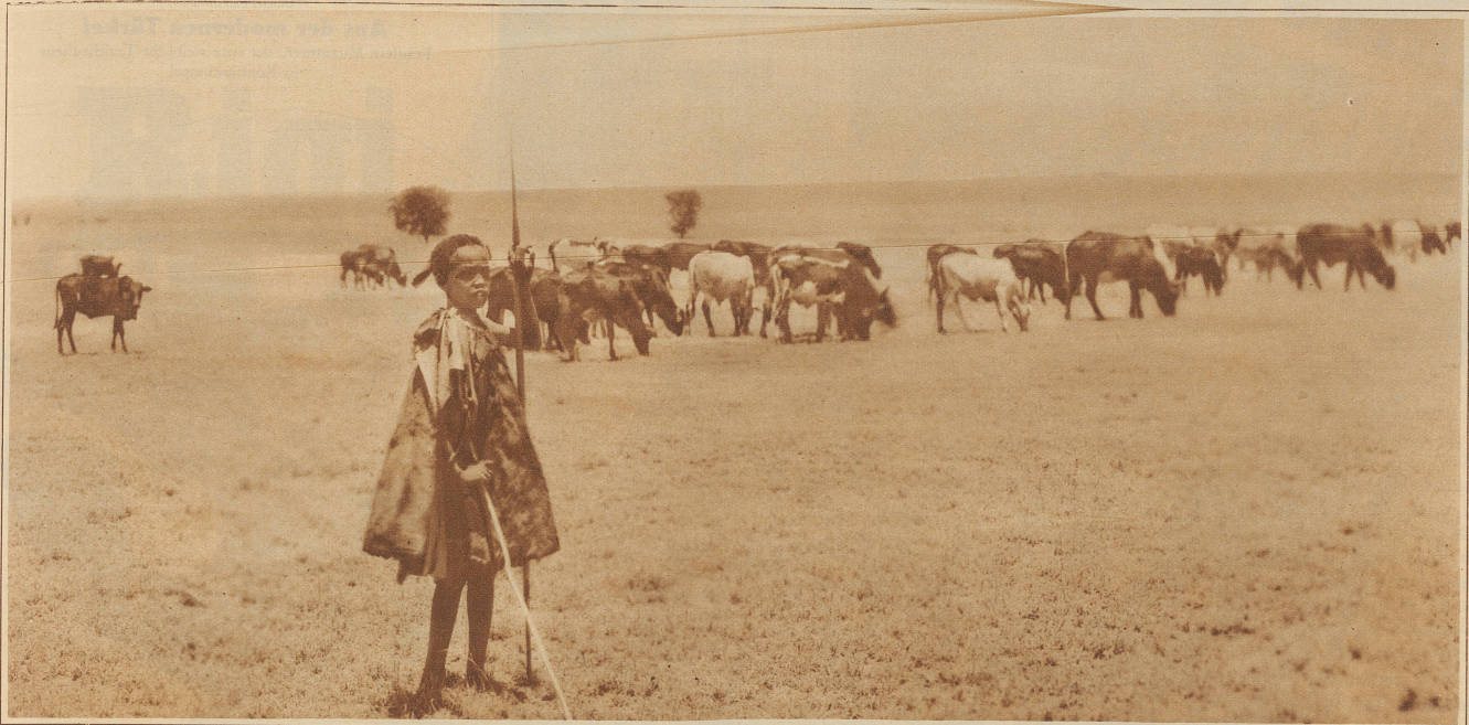
Hirtenknabe im Massajegebiet in Afrika, wo Mittelholzer mit seinem Flugzeug «Switzerland» gelandet ist