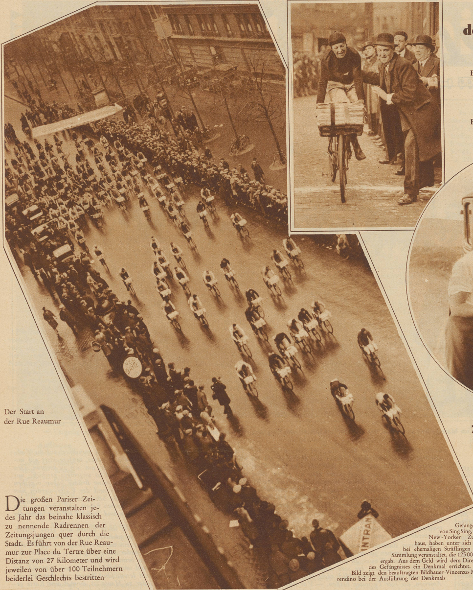
Der Start an der Rue Reaumur

Die großen Pariser Zeitungen veranstalten jedes Jahr das beinahe klassisch zu nennende Radrennen der Zeitungsjungen quer durch die Stadt. Es führt von der Rue Reaumur zur Place du Tertre über eine Distanz von 27 Kilometer und wird jeweils von über 100 Teilnehmern beiderlei Geschlechts bestritten