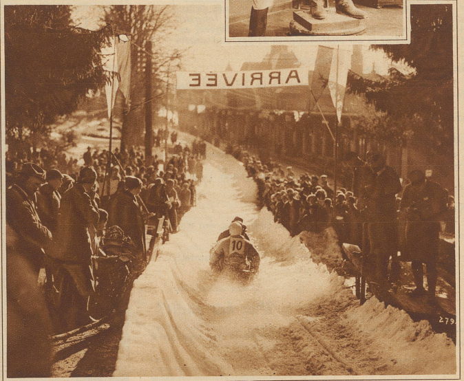
Bobsleigh-Weltmeisterschaften in Caux. Der Sieg fiel an eine italienische Mannschaft. Die Schweiz sicherte sich knapp vor Deutschland den zweiten Rang. Die Aufnahme zeigt einen Bob in der aufgeweichten Bahn am Ziel