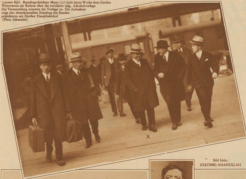
Unteres Bild: Bundespräsident Musy (X) hielt letzte Woche dem Zürcher Wirtverein ein Referat über die revidierte eidg. Alkoholverlage. Die Versammlung stimmte der Vorlage zu. Die Aufnahme zeigt den demokratischen Empfang des Bundespräsidenten am Zürcher Hauptbahnhof