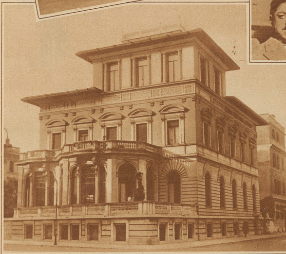
AMANULLAHS VILLA IN ROM