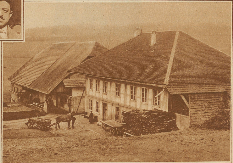
Das Geburtshaus von Bundesrat Rud. Minger in Müllchi (Bern).