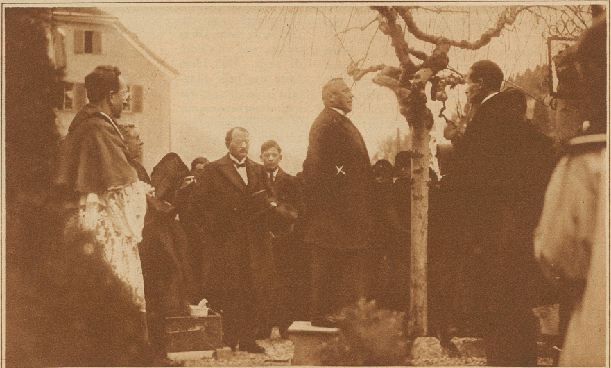
Bundesrat Minger (X) spricht am Grabe des verstorbenen Generaladjutanten auf dem Friedhof in Chur