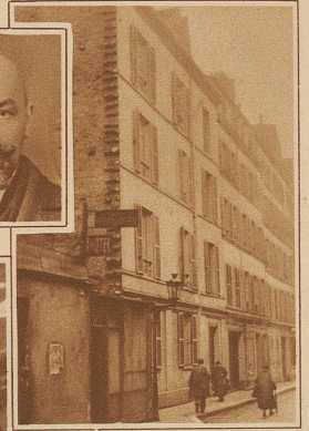
Das Haus, das der General kurz vor seiner Entführung verlassen hat. Links oben im Bilde: Der entführte General Kutjepow