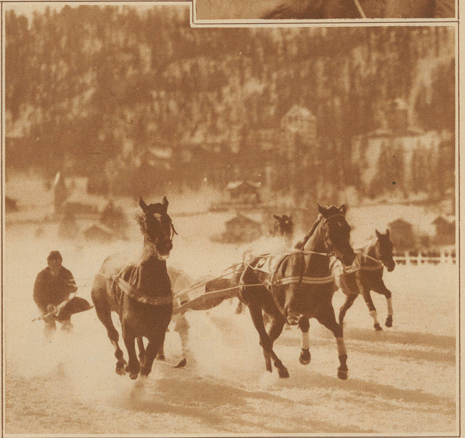
Der scharfe Finish im Skikjöring um den «Preis vom Inn»