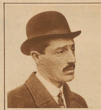
Der Herzog von Alba, ein großer Freund der Schweiz und ständiger Kurgast von St. Moritz, hat das Unterrichtsministerium übernommen