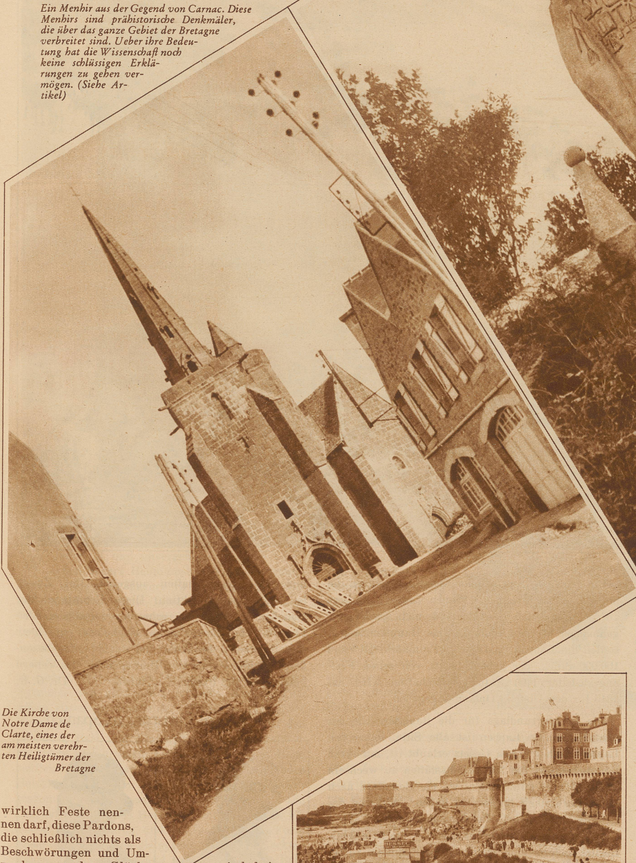
Die Kirche von Notre Dame de Clarte, eines der am meisten verehrten Heiligtümer der Bretagne

Diese Dolmen sind große, flache Steine, die oft aufrecht zur Höhe stehen oder manchmal auch tischförmig zusammengestellt wurden. Was sie eigentlich sind, vermag kein Mensch zu sagen. Aber gerade deshalb haben die Gelehrten ihnen so viele Deutungen gegeben: Es sollen Herkulesssäulen sein, Zeichen des Tierkreises, Altäre, auf denen oft Menschen geopfert wurden, Grabstätten und manches andere. Eine alte Sage will in ihnen sogar ein Riesenvolk sehen, das einst einen Heiligen ver-