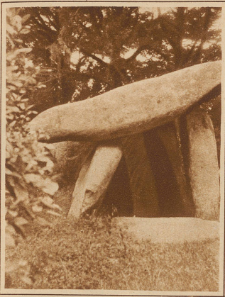
Ein Menhir aus der Gegend von Carnac. Diese Menhirs sind prähistorische Denkmäler, die über das ganze Gebiet der Bretagne verbreitet sind. Ueber ihre Bedeutung hat die Wissenschaft noch keine schlüssigen Erklärungen zu geben vermögen. (Siehe Artikel)

Blinder Sänger vor einem Menhir, auf dem die ersten Christen ihre Sinnbilder und Kennzeichen eingemeißelt haben