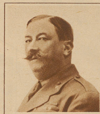
General Berenguer, der neue Ministerpräsident