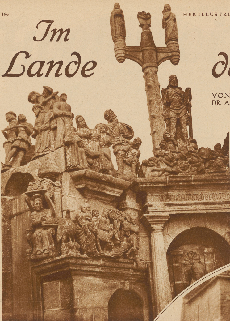
Detail am Beinhaus der Kirche von Guimilleau

mit geröteten Augenlidern und Lippen, die sich ständig bewegen, als ob sie mit einem unsichtbaren Wesen stumme Zwiesprache hielten. Da erkennt man mit Schauern die eine Großmacht dieses Lebens, die wie ein Schatten über allen schwebt: den Tod. Und wenn du nachher in den Kirchhof trittst, wiederholt dir jeder Grabstein, in klagendem, anklagendem Ton, daß der Tod diesen Dahingegangenen viel zu früh erschienen und daß er ihnen kein Erlöser gewesen sei. Wer darf es diesen Menschen da schließlich verargen, wenn sie nach Jahren der Arbeit, nach einem Leben, das in Beten, Beben und Bangen verging, ohne daß jemand ihr Flehen erhört und ihre Schmerzen gelindert hatte, — wer begriffe da nicht, daß sich manchmal der Trotz in ihnen aufbäumt und sie auch einmal Forderungen und Rechte geltend machen möchten?