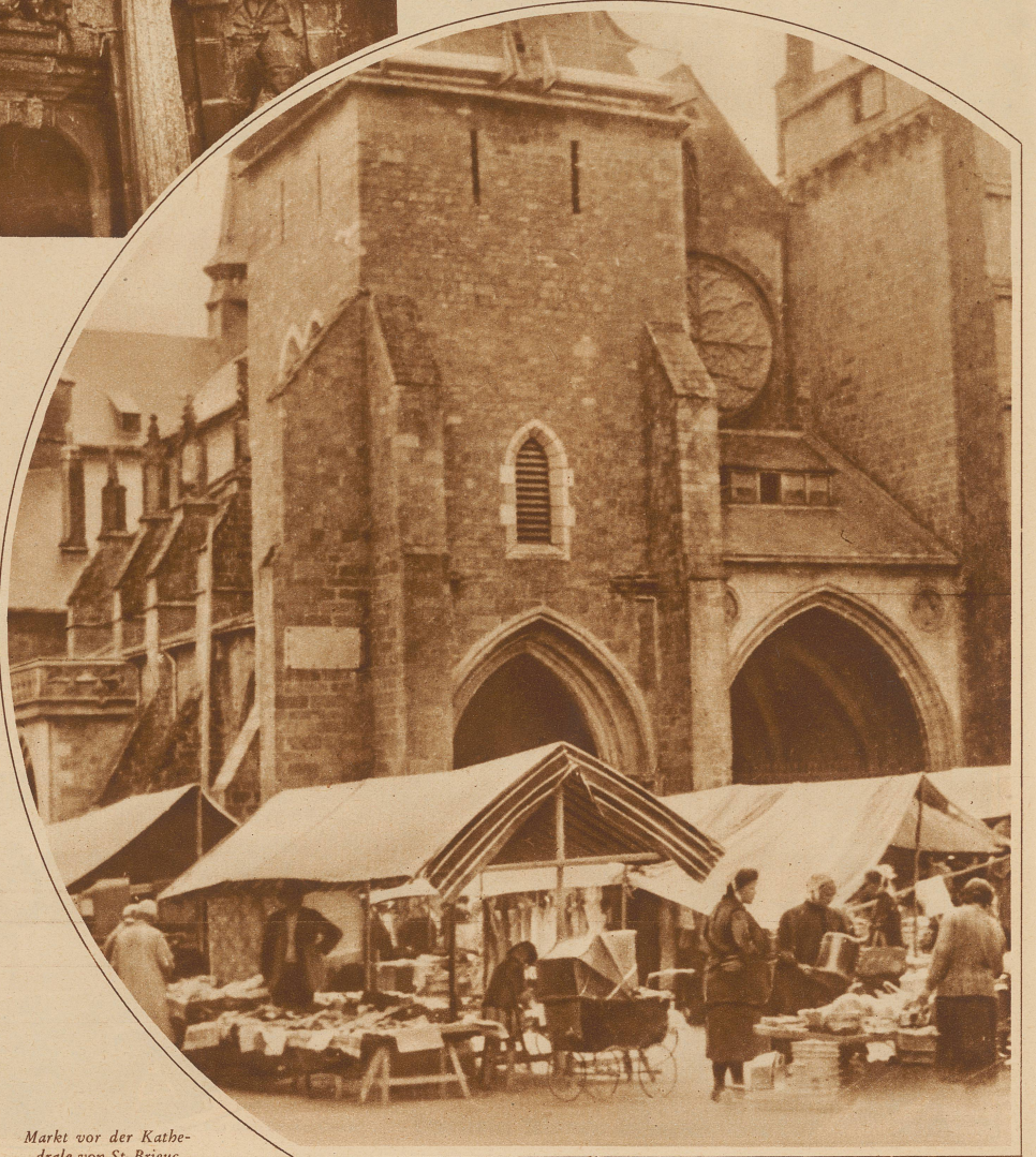
Markt vor der Kathedrale von St. Briec

Um sie zu verstehen, braucht man nur in eine der vielen Kirchen und Kapellen mit den hohen Spitzbogenfenstern zu treten. Vor dem Altar, im Schatten der Kruzifixe und Marienbilder, wird man alte, verhüllte Mütterchen knien sehen und neben ihnen schöne, bleiche Frauen.