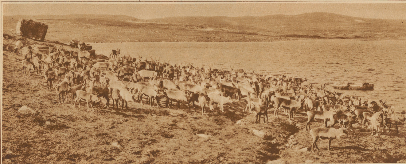
AN DER TRÄNKE