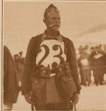
Ein strammer «Gebirgler» gibt seinem Vorgesetzten freudig Auskunft über die 25 km lange Fahrt