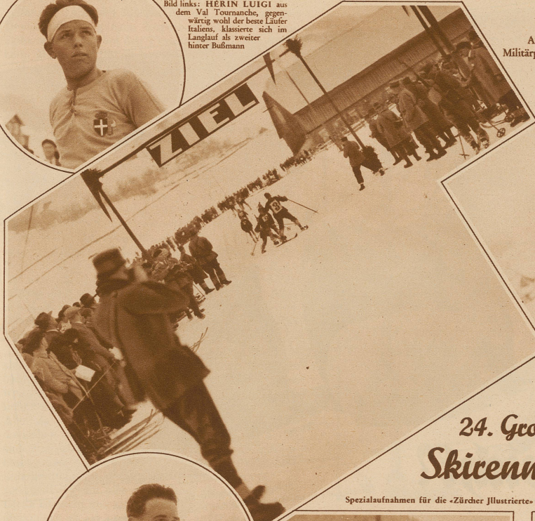
Am Ziel des Militärpatrouillenlaufes