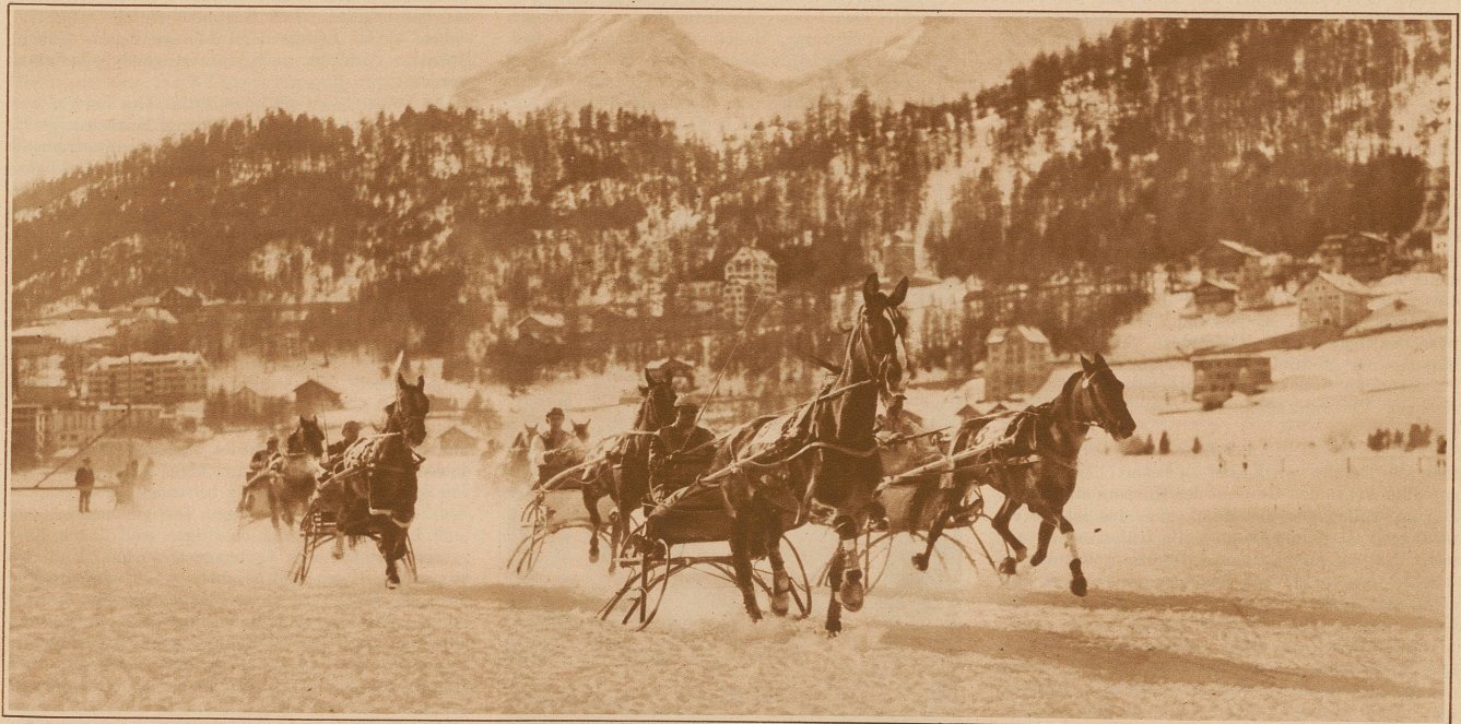
Pferderennen in St. Moritz. Traber im Rennen