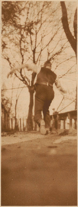
Der draußgängerische Kegler