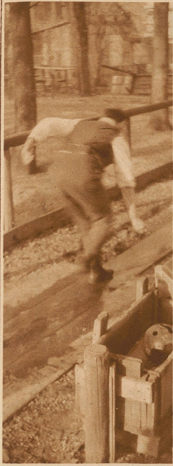
Der vorsichtige Kegler