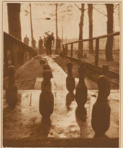
Oba lätz! Näbeduse

Defagter Mann macht wenig Freude Und er ist meistens unbeliebt, Weil er in kritischen Momenten Die allerdümmsten Sachen schiebt. Er schmeißt im Wies um, was grad fällt, Und hat «sein Sach» auf nichts gestellt!