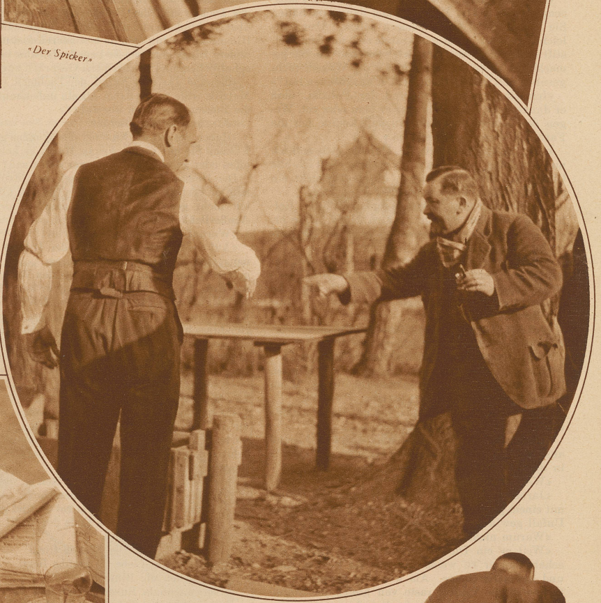
Der Sachverständige. Sie müend meh links abgäh und i d'Gaß ie hebe, dann wärdet Sie gseh, wies umgheied

Und kommt nach vorn das rechte Bein. Ein nächster rudert mit dem Fuß Und glaubt, daß so er treffen muß.