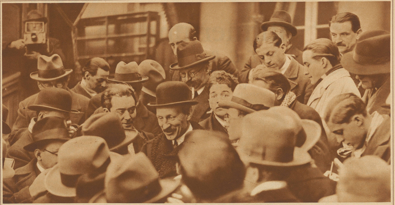
Der neue französische MINISTERPRÄSIDENT CHAUTEPS wird beim Verlassen des Elysees von Journalisten bestürmt. Das Kabinett, dem allgemein keine lange Lebensdauer vorausgeragt wird, hat sich am Dienstag der Kammer vorgestellt