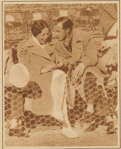
Ob daraus wohl eine Verlobung wird? Der amerikanische Tennischampion Tilden mit der deutschen Meisterspielerin Cilly Aufer in Nizza