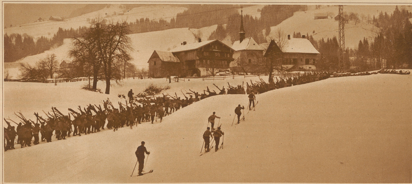
Keine militärische Marschkolonne, sondern das zivile Skibataillon froher Sportsleute, das Sonntag für Sonntag aufs «Hochstuckli» zieht