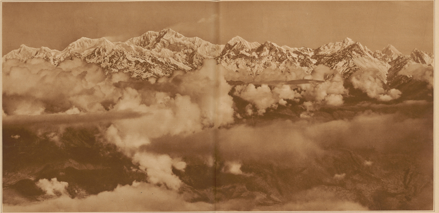
Der Kanchenjunga (höchster Gipfel links der Mitte) von Darjeeling aus gesehen. Distanz ca. 150 Km. (Telegraphische)