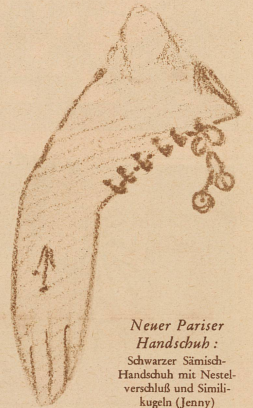
Neuer Pariser Handschuh: Schwarzer Strich- Handschuh mit Nestel- verschluss und Stimil- kugeln (Jenny)

Kurz oder halblang? ... das ist hier die Frage. Wenn Röcke länger, Hüte groß werden, warum soll dann der Handschuh kurz bleiben! — Als die Dame am Volant die hohe Manschette des pelzgefütterten Autohandschuhs über den Mantelärmel zog, fand sie das nicht nur praktisch, es schmeichelte auch ihrem Sinn für Eleganz. Und da der Handschuhfabrikant ein aufmerksamer Herr ist, legt er ihr nun zum neuen Frühjahrskostüm und Kleid sein neues halblanges Sortiment, wenn auch nicht zu Füßen, so vertrauensvoll in die Hand. — Typen in einfacher Form, aber mit Knopfschluß an der Seite, dunkle Handschuhe mit goldenen Knöpfen am Lederarmband, glatte Typen oben abgerundet und wie Etagevolants farbig eingefasst, gerade breite Stulpen aus verschiedenfarbigen Lederstreifen zusammengesetzt usw. usw. — Damit der kurze Einknopfhandschuh sich nicht vernachlässigt fühle, hat man ihn auch mit neuen Dekors bedacht, die weniger bunt und von ruhiger Linie sind. Auch amüsanter Ausgestaltung seiner «Raupen» schenkt man Beachtung. — Favorit der geschmackssicheren Dame sind der kurze bis halblange weiße und der lange schwarze Handschuh. Ersteren trägt sie im Theater. Der zweite kann mit und ohne Echo — in Ansteckblume und Schuh — einer bereits getragenen hellen, Abendrobe neuen pikanten Akzent verleihen. tp.