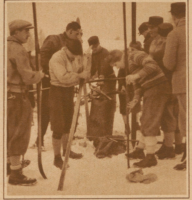
Wie die Norweger wachsen. Nicht, wie es bei uns oft geschieht, schon am Vorabend oder doch einige Stunden vor dem Rennen. Nein, erst am Start, wo man den Schnee genau beurteilen kann. Zu diesem Zweck werden immer kleine Oefchen mitgenommen, jenen auf etwa ein Dutzend Fahrer eines