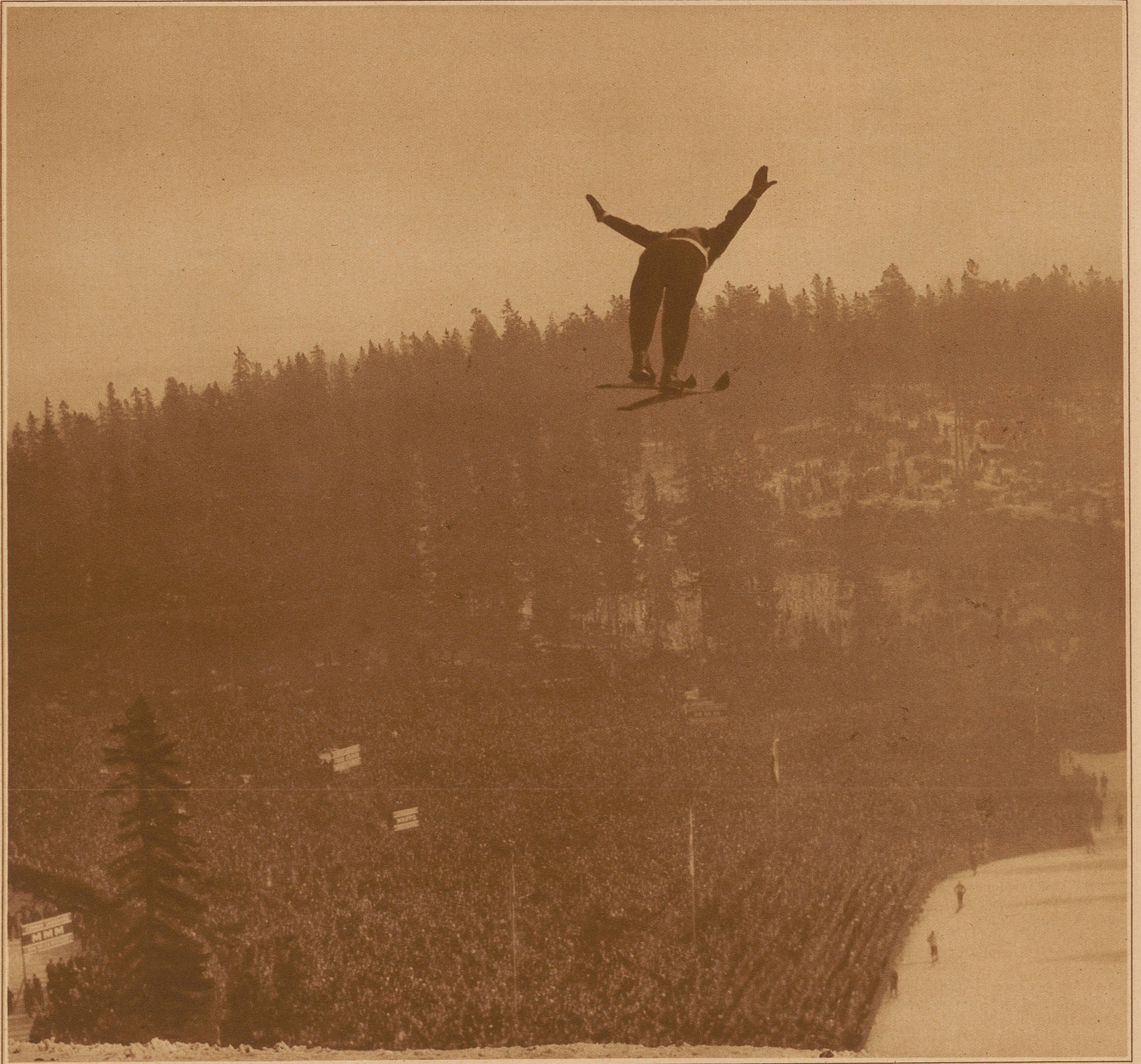
Sprunglauf auf der Holmenkollenschanze, der klassischen Stätte des norwegischen Skisportes. In der Tiefe sieht man, Kopf an Kopf, einen Teil der gewaltigen Zuschauermenge von 70 000 Personen, ein auch in Norwegen bisher nicht gesehener Rekordbesuch