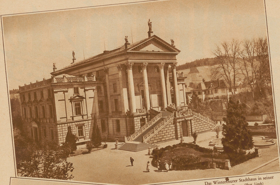
Das Winterthurer Stadthaus in seiner heutigen Form