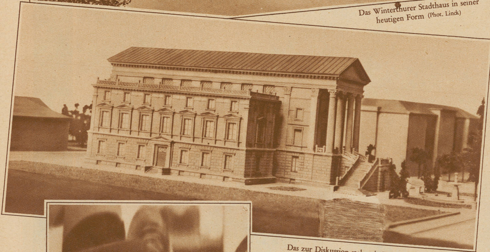
Das zur Diskussion stehende Erweiterungsprojekt von Architekt Völki