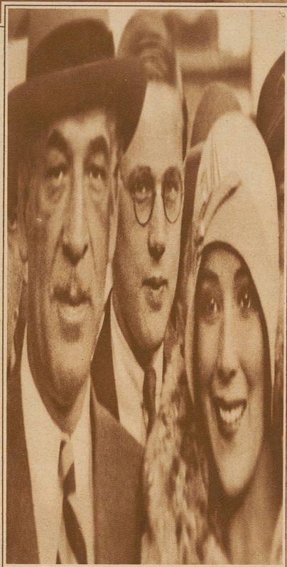
So lange Gesichter hat das Umbauprojekt bei einzelnen Winterthurnern hervorgerufen